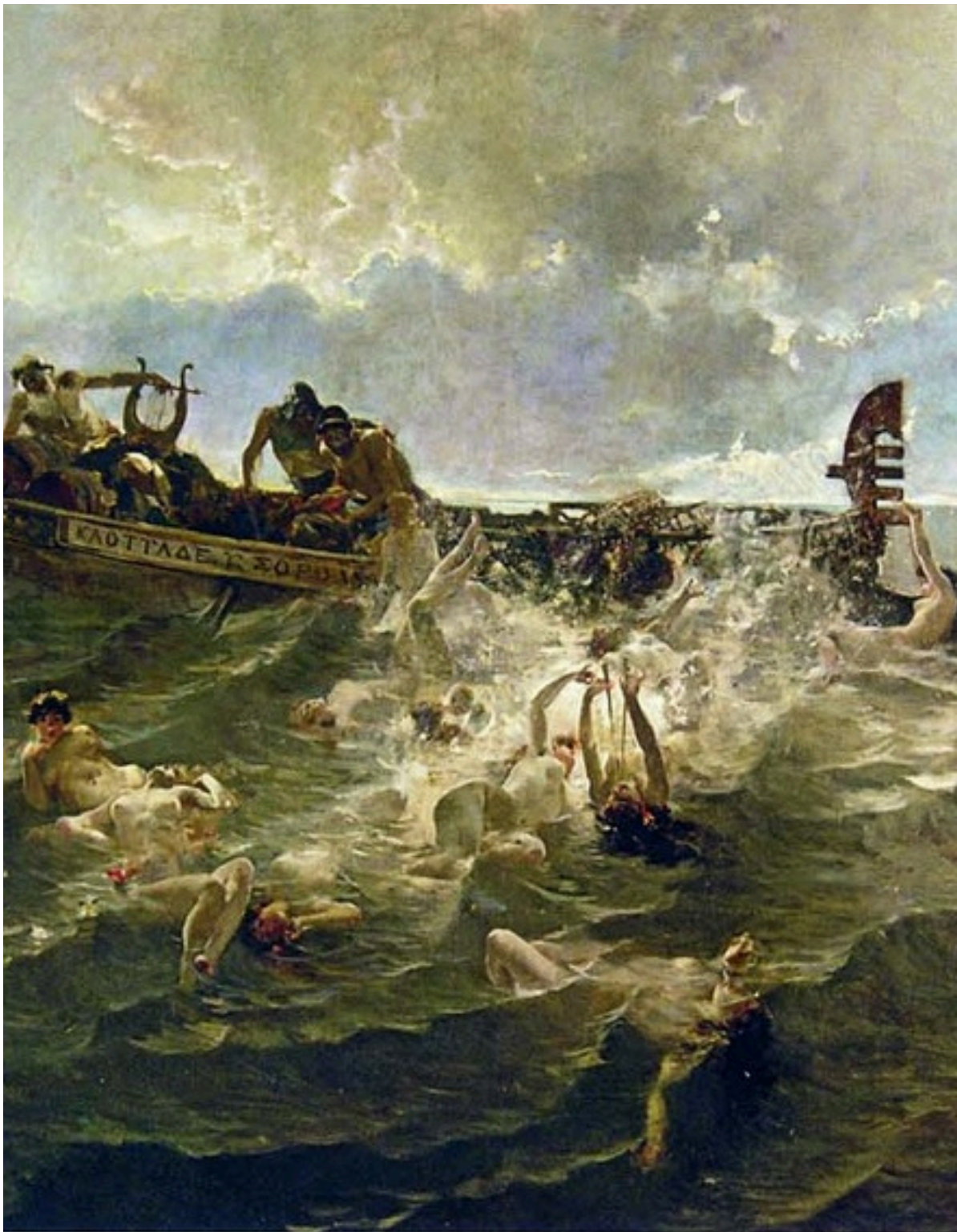
Les Néréides - Joaquín Sorolla (1863-1923)

Il s'agit ici de se servir de l'art pour redorer le lien entre l'Homme et la nature, et rappeler notre responsabilité envers la mer et ses créatures en invitant à méditer sur l'équilibre fragile de notre environnement. En un sens, inviter les spectateurs à endosser, à travers une prise de conscience, le rôle des Néréides en devenant gardien des trésors qu'ils contemplent.