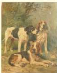
Chiens de chasse au repos, huile sur toile, 32,3x41 cm, (collection privée).