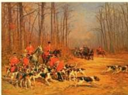
Le départ pour la chasse, huile sur toile, 64,5x75,5 cm, (O. Orenat).

Décédé à Marlotte, il repose au cimetière de Bourron et une rue du village porte son nom.