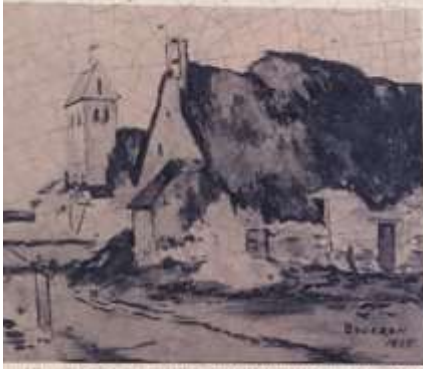
Joseph Brousse, L'Église de Bourron-Marlotte en 1857, avant 1871 et 1876, Musée-Musées Bourron-Marlotte

nef, inscrite aux Monuments Historiques, conserve les traces des plus vieux éléments de l'église : piliers massifs avec des impostes au décor abîmé, toutes différentes, arcs en plein cintre, arc surbaissé entre la nef et ancien chœur. Ce dernier conserve plusieurs cuts-de-lampe, de facture médiévale ou Renaissance.