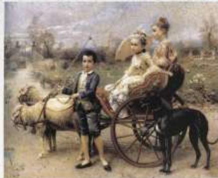
Nel parco , huile sur toile, 20,1 x 24,4 cm, don de l'École de la Municipalité de Spolète en 1906 représentant ses trois enfants dans le jardin de la Villa Marguerite à Marlotte.

La Mairie-Musée de Bourron-Marlotte possède un tableau de C. Detti, donné par sa belle-fille intitulé Chevalier contant fleurette .