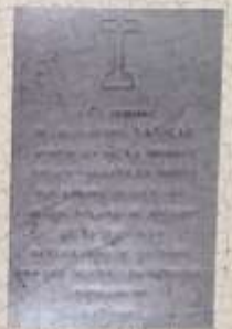
Pierre tombale de Michel Vasselin

La statue, des XVI e - XVII e siècles, représente Sainte Arvay, Saint Jacques et Sainte Barbe. Un Saint Pierre en bois polychrome (1930) est dû au sculpteur bourguignon Fernand Py (Versailles 1887 - Montesson 1949).