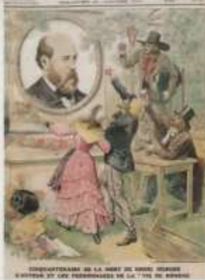
Cinquante-neuf de la mort d'Henry Murger

En 1895, un monument à sa mémoire, réalisé par le sculpteur Henri Bouchon, est inauguré au jardin du Luxembourg.