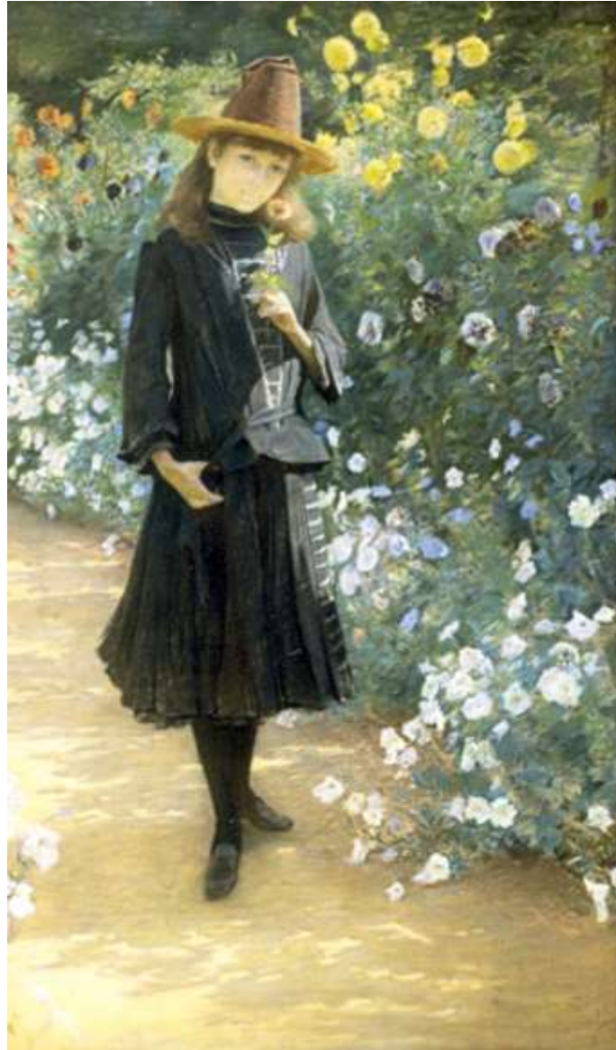
Armand Point, La jeune fille aux liserons