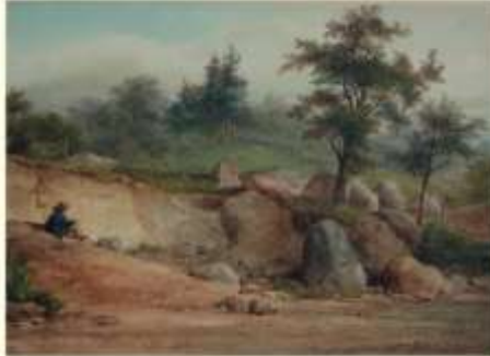
Eugène Cicéri, Vue de Marlotte , aquarelle, 1866, 28,6 x 21,1 cm, collection privée.