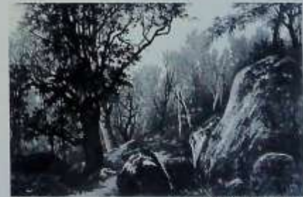
Paysage de Forêt, Fusain, 65x46 cm, reproduction en héliogravure, Collection privée.

Après un séjour d'une vingtaine d'années en Bretagne, il s'installa définitivement à Marlotte en 1875 à la villa Les Roches , rue Murger, puis aux Clématites rue de Samoïs (aujourd'hui rue Auguste Allongé). Enfin il fit construire dans cette même rue par l'architecte Jeannot sa propriété Les Sorbiers qui fut sa dernière demeure.