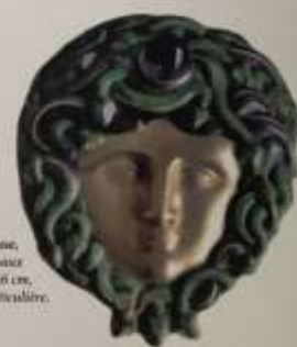
Pendeloque à la méduse, Hérou en or, émail et améthyste, 7 x 6 cm, collection particulière.

La Mairie-Musée de Bourron-Marlotte possède 6 œuvres d'Armand Point.