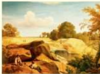
Théodore Caruelle d'Aligny, Carrère dans la forêt de Fontainebleau , 1833, huile, 163x215 cm, (Ville de Clermont-Ferrand, musée d'art Roger-Quillat MARC).

En 1825, il rencontre en Italie Camille Corot qui « aimait s'avouer l'élève, le fils spirituel et l'ami de Caruelle d'Aligny ». Il l'invite souvent à Marlotte et tous deux exposent au Salon de Paris en 1833. Il termine sa carrière comme Directeur de l'École des Beaux-Arts à Lyon et fut nommé membre de l'Institut en 1863.