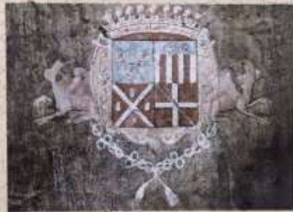
Livre de famille

En 1847, le cloistère, qui entourait l'église depuis près de neuf siècles, fut transféré à son emplacement actuel. Ce transfert permit la découverte de nombreux vestiges archéologiques, néolithiques, gaulo-romains et mérovingiens, attestant ainsi l'ancienneté du lieu.