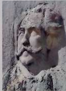
Portrait sculpté sur sa pierre tombale au cimetière de Bourron-Marlotte.

Par sa notoriété et l'abondance de sa production durant la dernière période de sa vie, il contribua au rayonnement artistique de la forêt de Fontainebleau à la fin du 19 e siècle.