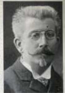
Portrait de Paul Margueritte.