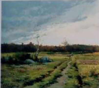
Chemin vers la forêt, aquarelle, 50 x 39 cm, collection Mairie-Mairie de Bourron-Marlotte, Conseil Général de Seine et Marne, cliché Y. Bourhis.

Auguste Allongé affectionne les rochers moussus, les sous-bois, les hauteurs dégagées. En toutes saisons, par tous les temps, l'on était sûr de le trouver assis sur sa sellette de paysagiste, soit dans la plaine de Bourron, soit dans la forêt aux abords de la Mare-aux-Fées. Il fut un brillant illustrateur de Bourron-Marlotte et de ses environs.