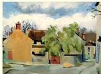
Madeleine Hout, Vue d'une rue de Marlotte , huile, 21,7x34,8 cm, Musée-Musée de Bourron-Marlotte, (cité Y. Bourbié).