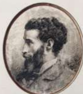
Autoportrait, 1882, fusain sur papier, 41 x 34 cm, collection Robert Dost.

Il expose aux Salons des toiles de plus en plus symbolistes où la femme devient le premier centre d'intérêt de l'artiste. Après 1900, A. Point exécute une série de tableaux inspirés de la mythologie grecque, notamment « L'Effort Humain », influencé par Elémir Bourges.