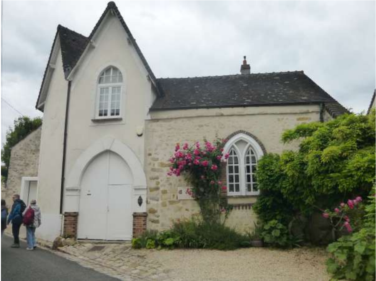
Maison du peintre Armand Point