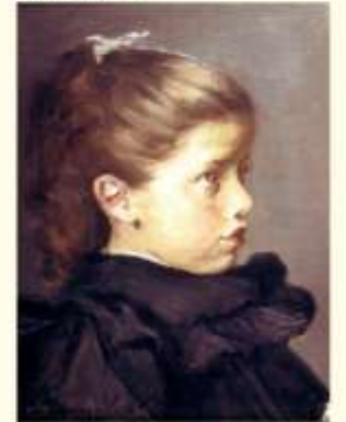
LA PETITE ÉCOLIÈRE 1906

« Quarante siècles d'art et de gloire », Hachette, 1921.