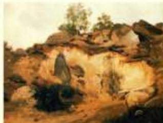
Jean-Baptiste Corot, Fontainebleau, Les Carrères de la Chaise-Martin , 1833, huile, (localisation inconnue).