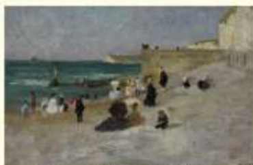
Yport, 1874, huile sur toile, 18 x 33,5 cm, (Musée de Charlieu).