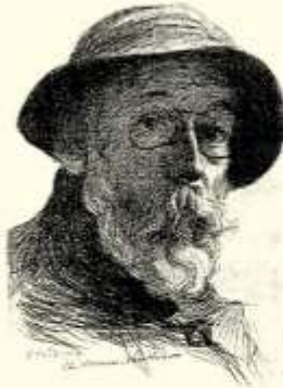
AUTO PORTRAIT 1916

Comme vous êtes capable de regarder et de réfléchir, toute liberté vous reste (...) d'admirer à votre gré les tableaux et les artistes, de préférer les uns ou les autres (...), de former vous-même votre opinion (...). L'important n'est pas de savoir pourquoi une rose sent bon et une cerise est savoureuse. Il est nécessaire avant tout de posséder assez de goût et d'odorat pour éprouver du plaisir à respirer l'une et à manger l'autre.