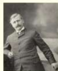
Portrait de Victor Margueritte.

Romancier et fervent défenseur de l'émancipation de la femme, il publie des essais et pamphlets pacifistes ainsi que de nombreux romans dont Femme en chemin (1921), La Garçonne (1922), Ton corps est à toi (1927) qui provoquent à l'époque un vrai scandale.