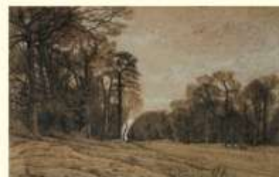
Forêt de Charilly, 1863, fusain et craie, 24 x 37 cm, (Musée de Charlieu).

Vers 1902, sa santé et sa vue déclinent et il renonce à la peinture. Une grande partie de son œuvre fut léguée au musée de Charlieu.