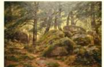
Émile Michel, Sous-haut en Forêt de Fontainebleau , huile, 187x201 cm, 1894, (O J. Munch, Musée de la Cour d'Or, Metz-Métropole).

Il devient propriétaire de La Roche Beauregard en 1890 et ce domaine restera dans la famille jusqu'en 1970. Peintre et écrivain d'art, artiste attaché à la tradition, son ouvrage La Forêt de Fontainebleau, dans la Nature, dans l'Histoire, dans la Littérature et dans l'Art est publié après sa mort et « couronne sa vie d'artiste et de critique d'art ».