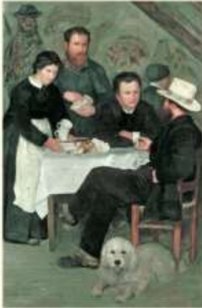
Auguste Renoir (1841-1919) : Le cabaret de la Mère Anthony , 1866, huile, 195 x 130 cm, National Museum of Fine Arts, Stockholm, Suède.