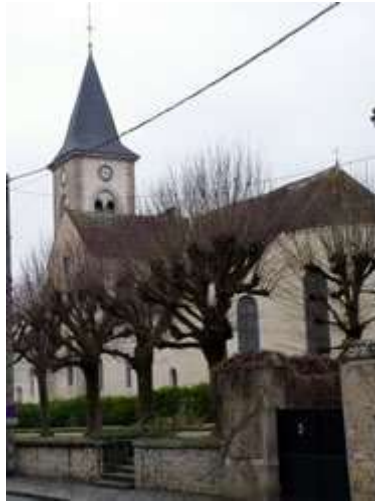
Eglise de Bourron

Dédiée à Saint Sévère (346-389) et à Sainte Avoye (martyre du V's.), elle est une des plus anciennes églises du gâtinais français (début XI e siècle). Reconstituée en partie aux XV et XVI siècles, elle subit ensuite les événements révolutionnaires. En 1847, le cimetière entourant l'église est transféré à son emplacement actuel, révélant de nombreux vestiges archéologiques. La nef, inscrite aux Monuments Historiques, conserve les traces des plus anciens éléments de l'église. Des travaux d'agrandissement et de restauration entrepris de 1857 à 1862, entraînaient la disparition du vieux clocher. Sur certains piliers, des lettres du XVIII e siècle, décors peints sur les murs représentent les armes des familles des châtelains. En 2013, un nouvel orgue romantique allemand, réalisé par le facteur Y. Fossaert, fut béni par l'évêque J.-Y. Nahmias et éveillé par l'organiste E. Lebrun.