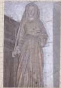
Statue de Sainte Arvay

De haut en bas et de gauche à droite nous trouvons un premier quartier : d'azur à trois châteaux d'or posés deux et un, armes des Varennes. En deuxième quartier : d'argent à trois pals de guise au chef d'acier chargé de deux quintefeuilles d'argent, armes des Beringhen. En troisième quartier : de guise au sautoir d'argent, cantonné de quatre billettes d'or, un des quartiers des armes des Sallard. En quatrième quartier : de guise à la croix fléchée d'argent, chargée d'une croix de même brochant, armes des Kerpeven.