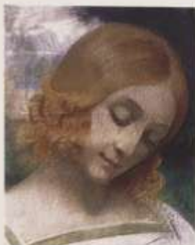
Arvid (Etude de visage), 1895 huile sur toile, 41 x 33 cm, collection particulière.

Armand Point, né à Alger, orphelin à l'âge de 7 ans, est élevé à Paris par sa tante. A 17 ans, il retourne en Algérie où il commence avec succès une carrière de peintre orientaliste.