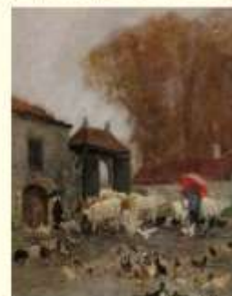
Cour de ferme, huile sur toile, 17 x 23 cm, (Musée de Charlieu).