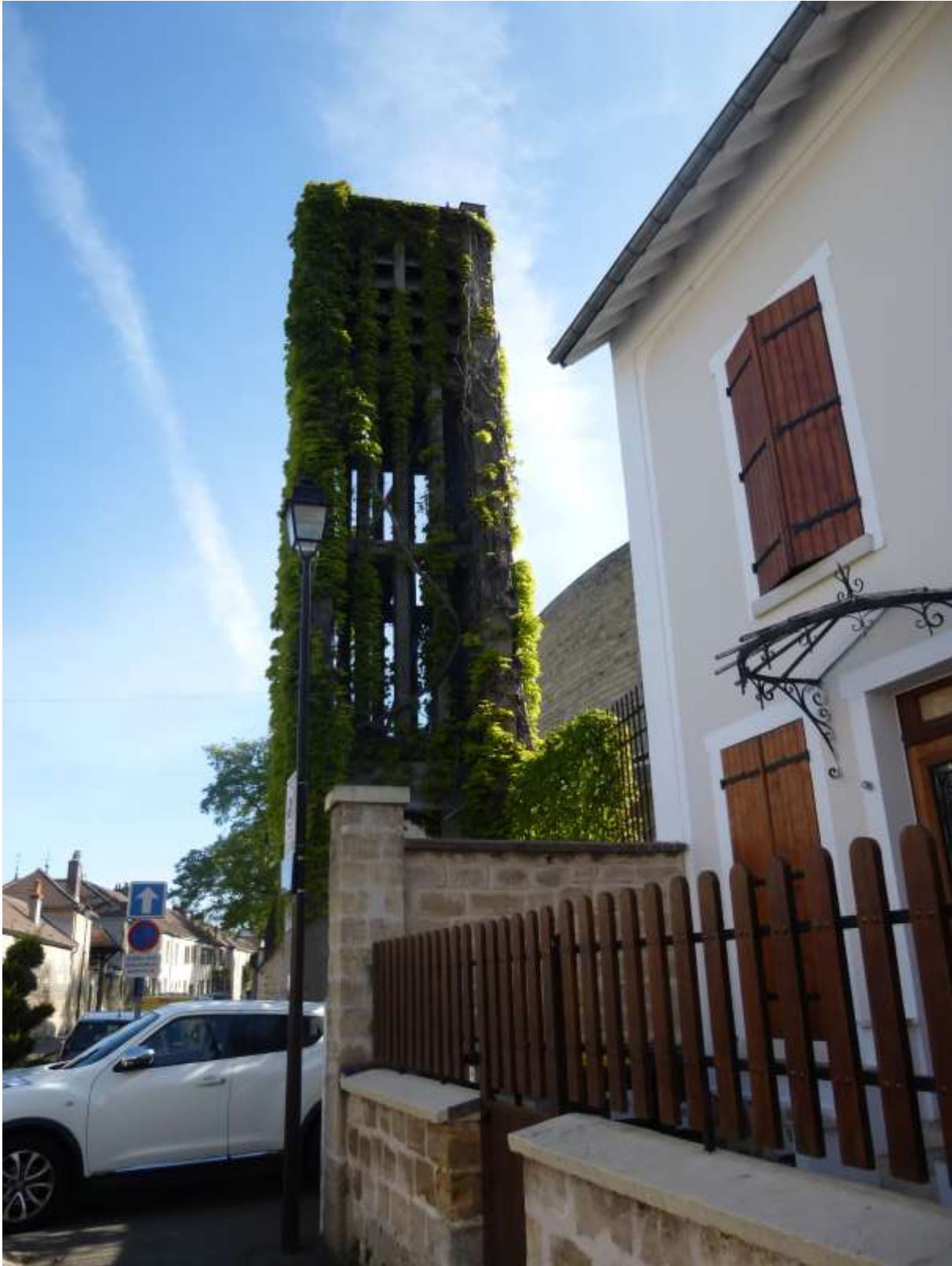
Eglise Saint Pie X