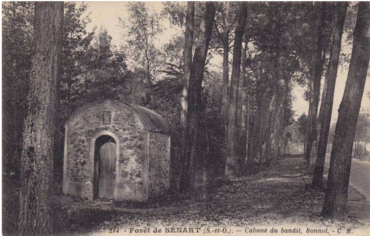
Cabane de Bonnot

La seconde histoire concerne le vol d'une limousine De Dion-Bouton par la Bande à Bonnot, le 25 mars 1912, à la sortie de Montgeron. Après avoir abattu le chauffeur et le propriétaire de la voiture (qui survivra finalement à ses blessures), la voiture servit au braquage de la Société générale à Chantilly, selon la technique mise au point par Bonnot qui savait que les gendarmes, ne disposant que de vélos et de chevaux, ne pouvaient le rattraper.