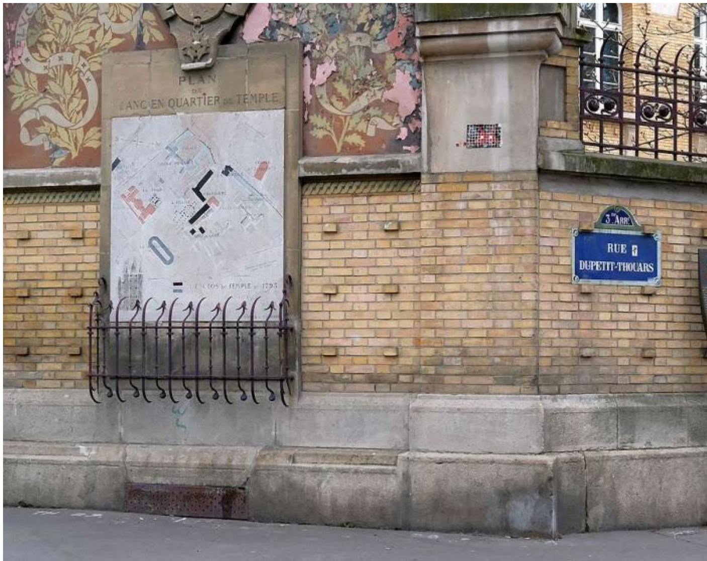
Plan de l'enclos du Temple au croisement des rues Gabriel-Vicaire et du Petit-Thouars