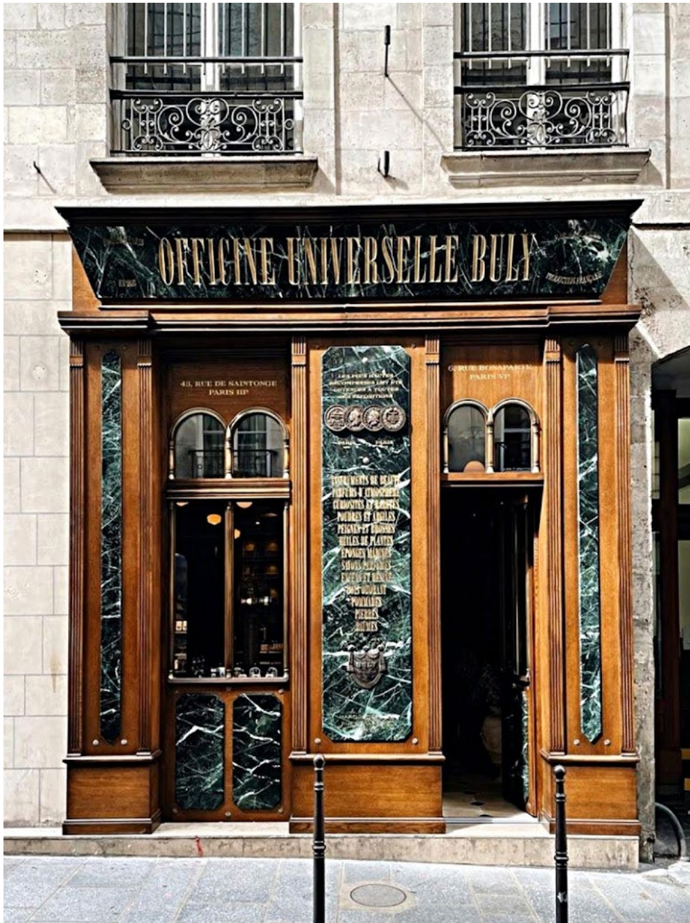
Officine universelle de Buly – 19 Rue Vieille-du-Temple