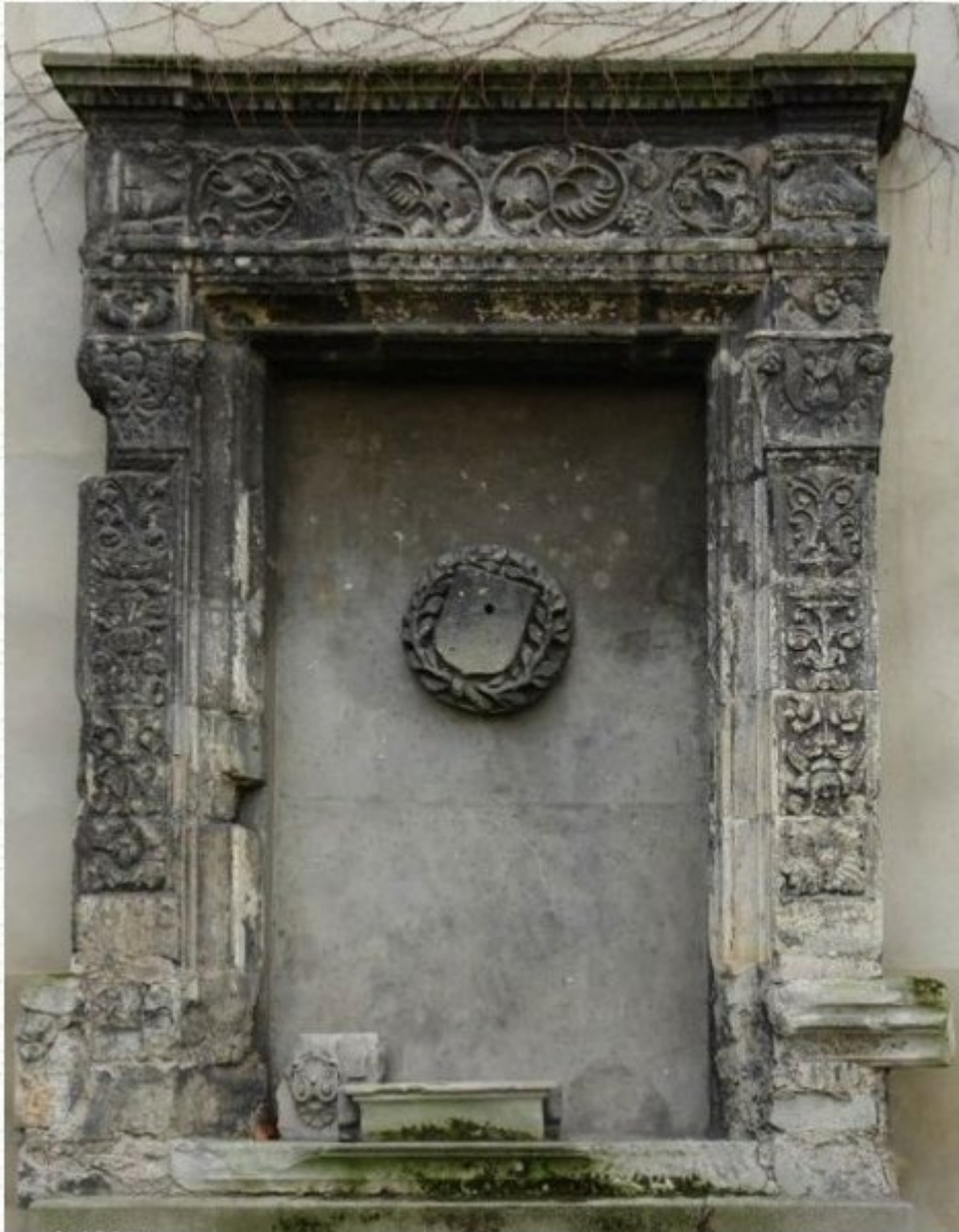
fenêtre de l'hôtel de Thou

En 1898, le percement de la rue Danton entraîne la démolition d'une partie des immeubles situés sur la place Saint-André-des-Arts, dont le n°11.