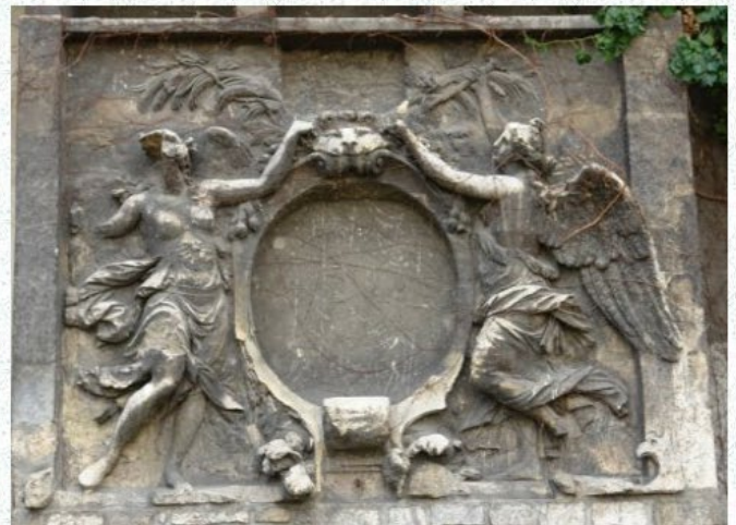
château de Saint Germain-en-Laye