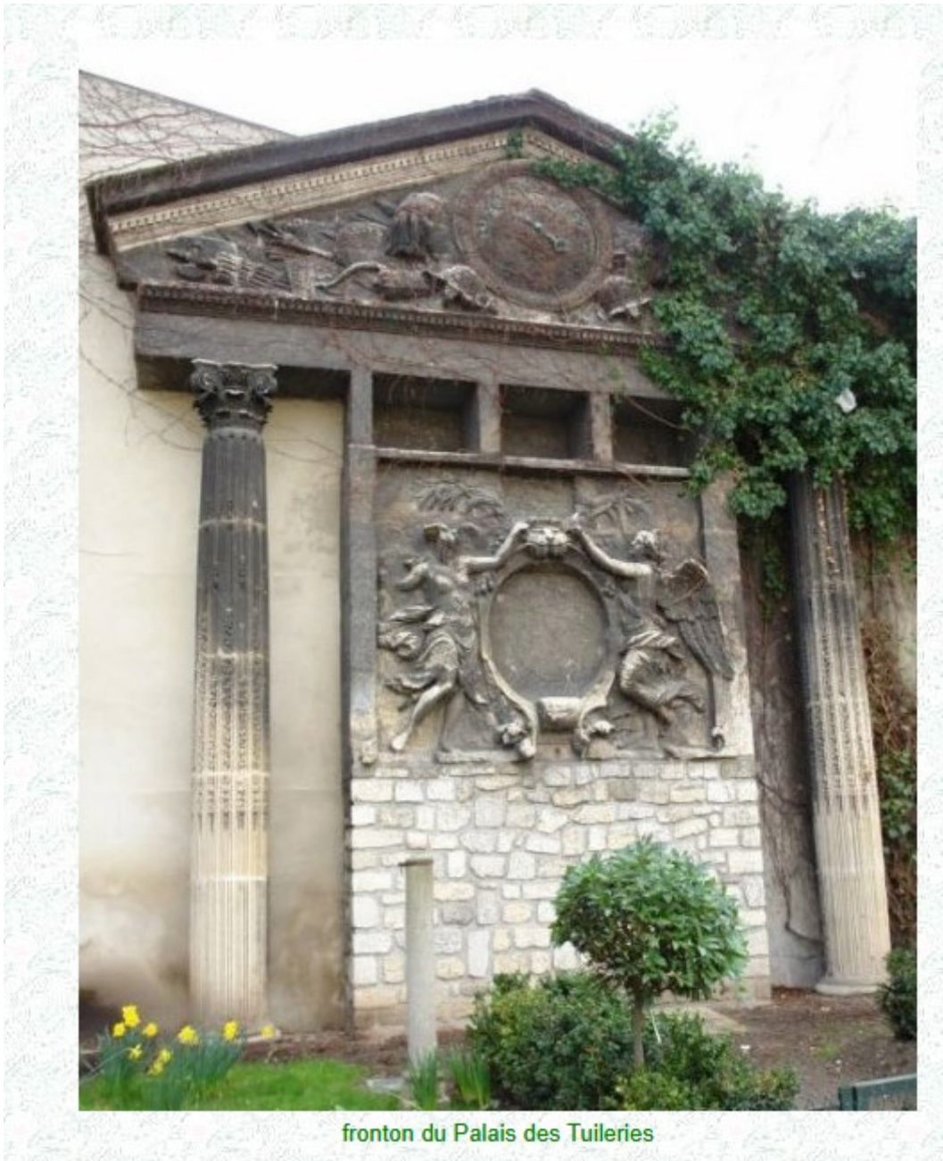
fronton du Palais des Tuileries