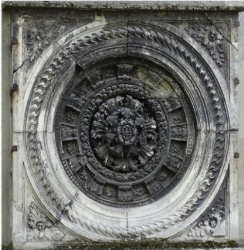
rosace de l'ancien Hôtel de Ville