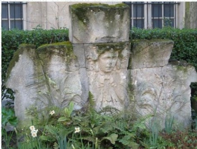
bas-relief du grenier à sel

Baptisé en l'honneur du peintre Georges Cain, conservateur du Musée de l'Histoire de la Ville de Paris au tournant du XXe siècle, ce petit parc circulaire d'à peine 2 000 m 2 voit le jour en 1923. En passant ses grilles, on découvre un véritable petit musée en plein air : il abrite en effet plusieurs vestiges, pour la plupart venant de monuments disparus lors de la Commune de Paris, comme cet imposant portique ionique rescapé du Palais des Tuileries.