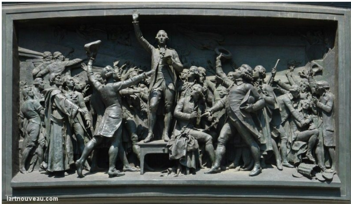
Serment du Jeu de paume 20 juin 1789