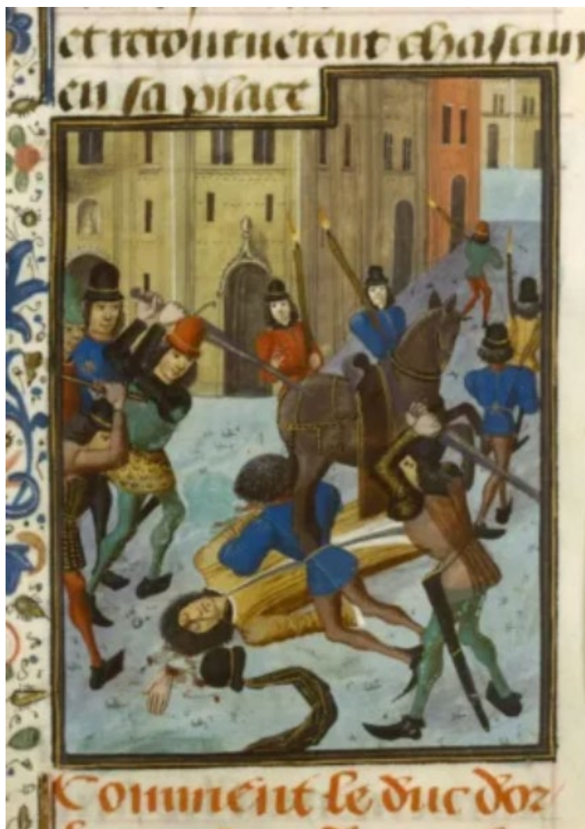
Assassinat du duc Louis d'Orléans, enluminure de l'Abrégé de la Chronique d'Enguerrand de Monstrelet