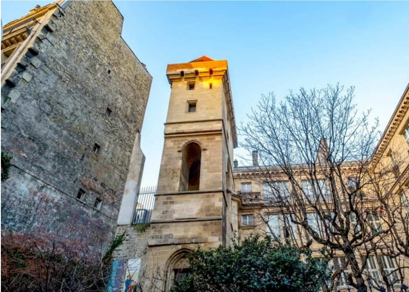
La Tour Jean Sans Peur à Paris, édiflée au début du XVe siècle