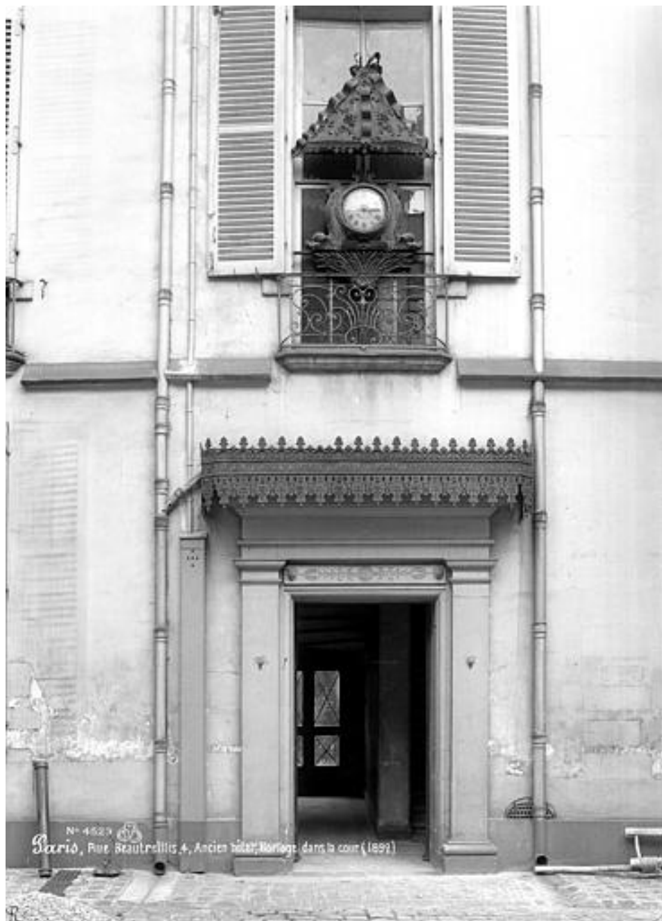
L'emplacement de l'horloge dans l'hôtel