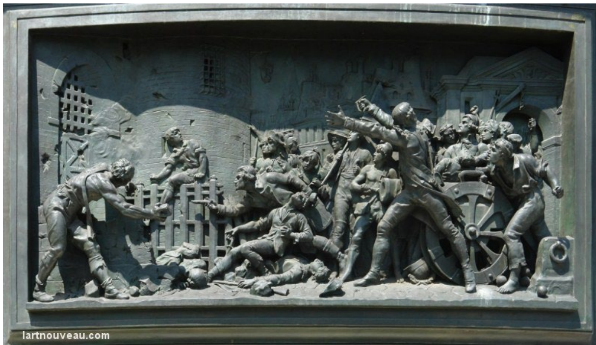
Prise de la Bastille 14 juillet 1789