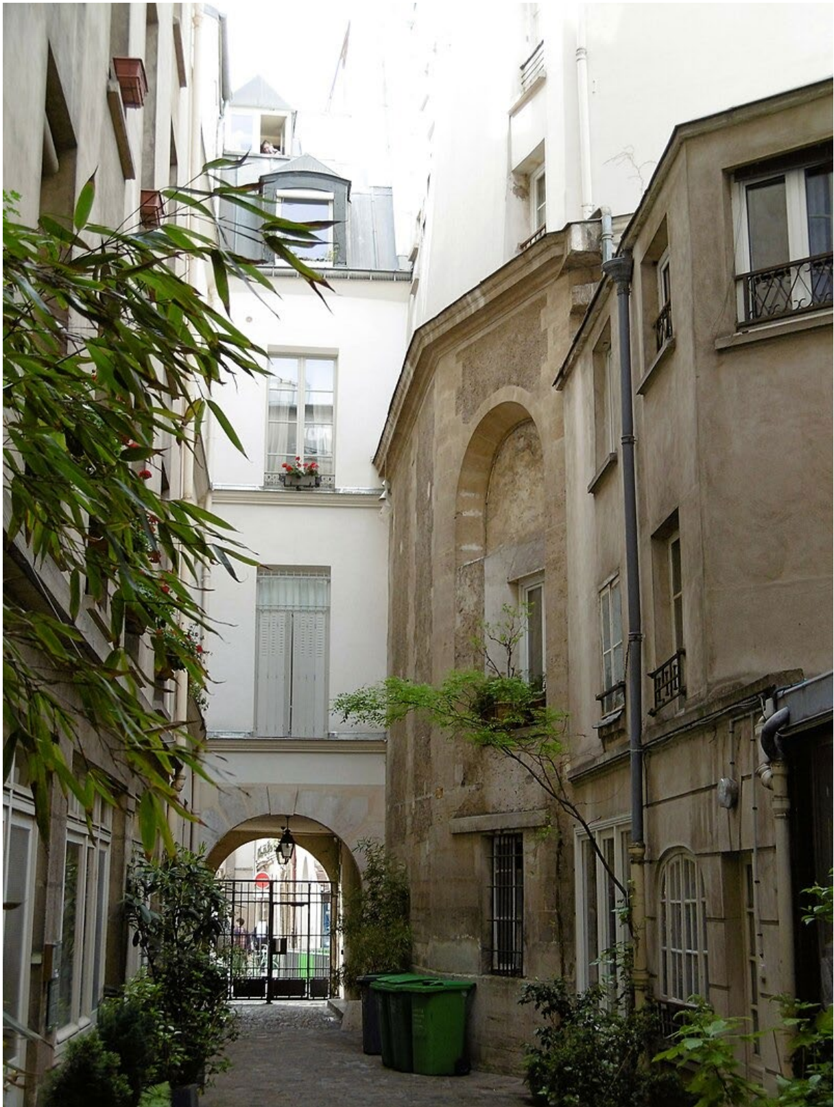
90 rue des archives chapelle de l'hospice des Enfants rouges