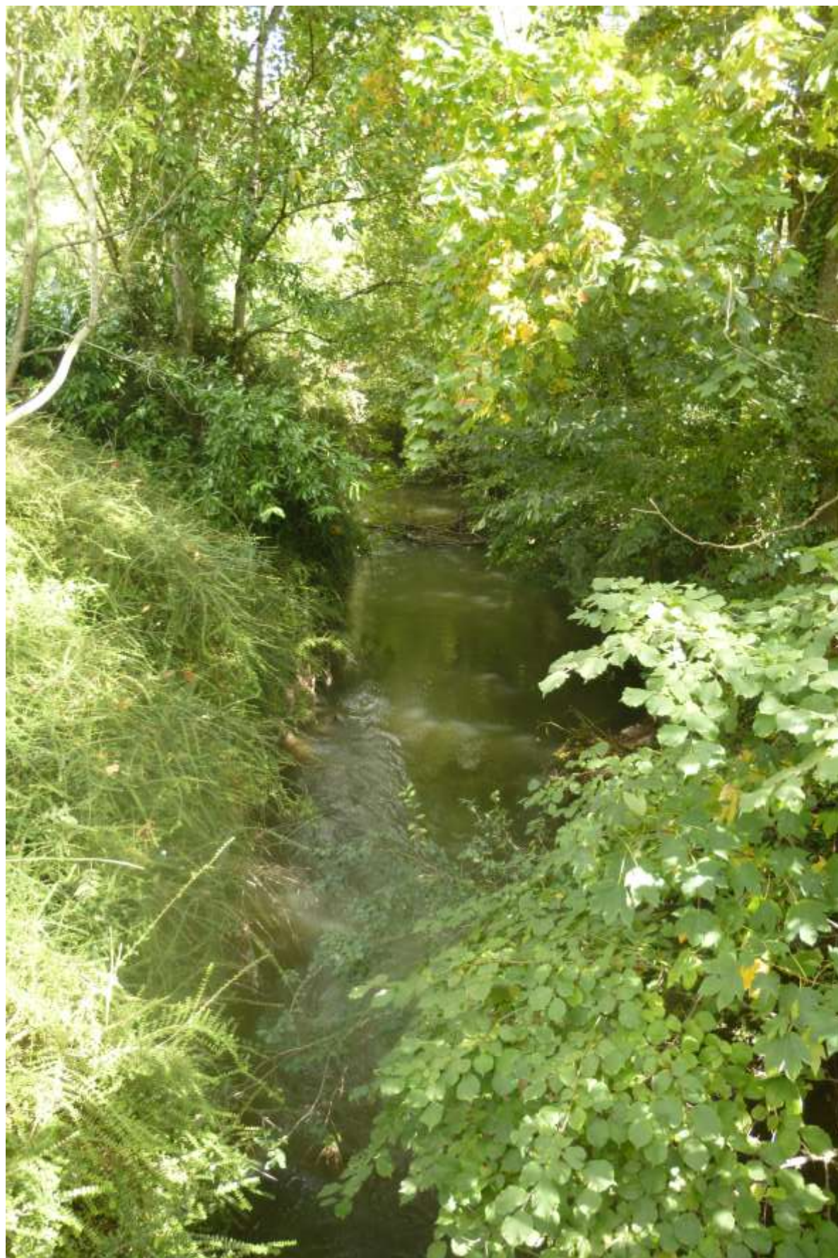
Canal de l'Ourcq