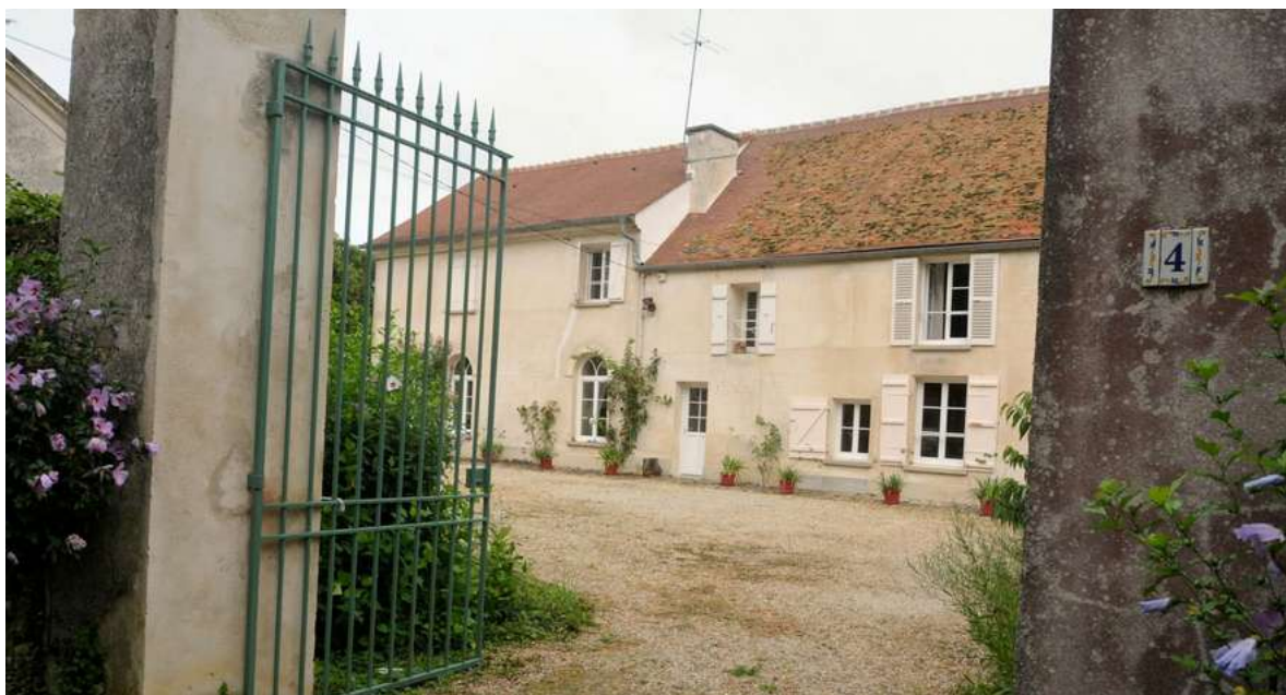
Le Prieuré acheté par Alain Delon où il vécut avec Romy Schneider puis avec Nathalie Delon