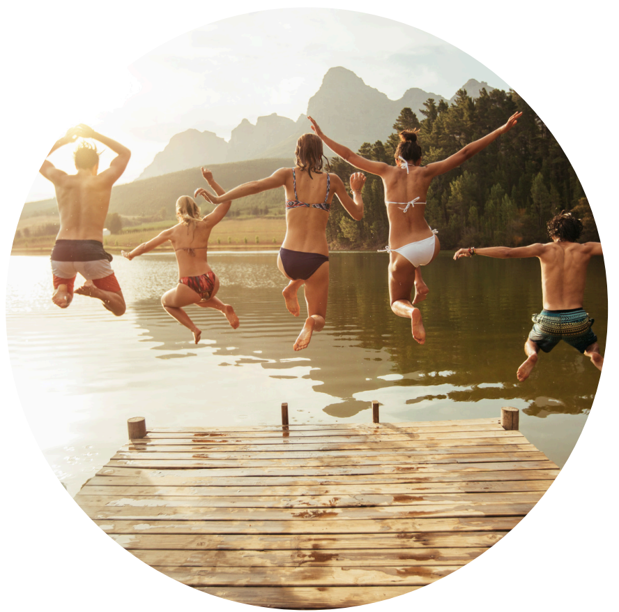
Nadar en un lago