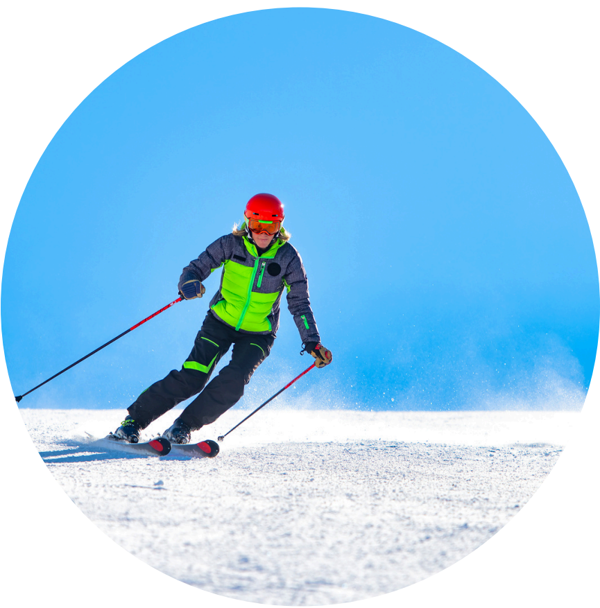
Esquiar en la nieve