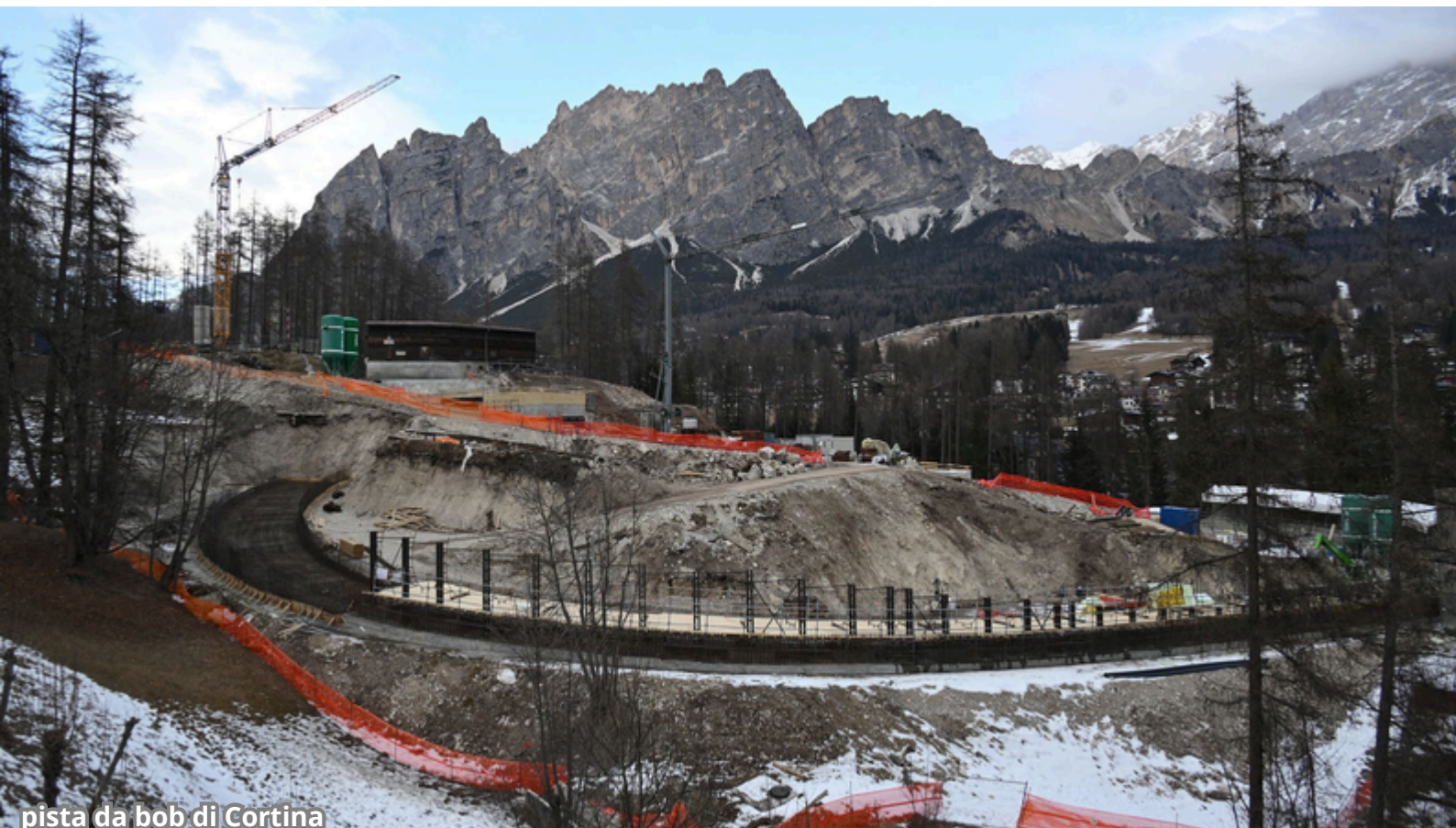
pista da bob di Cortina