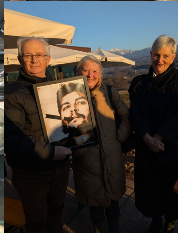
foto dal pranzo di Sinistra italiana Belluno dell'11 gennaio a Mel