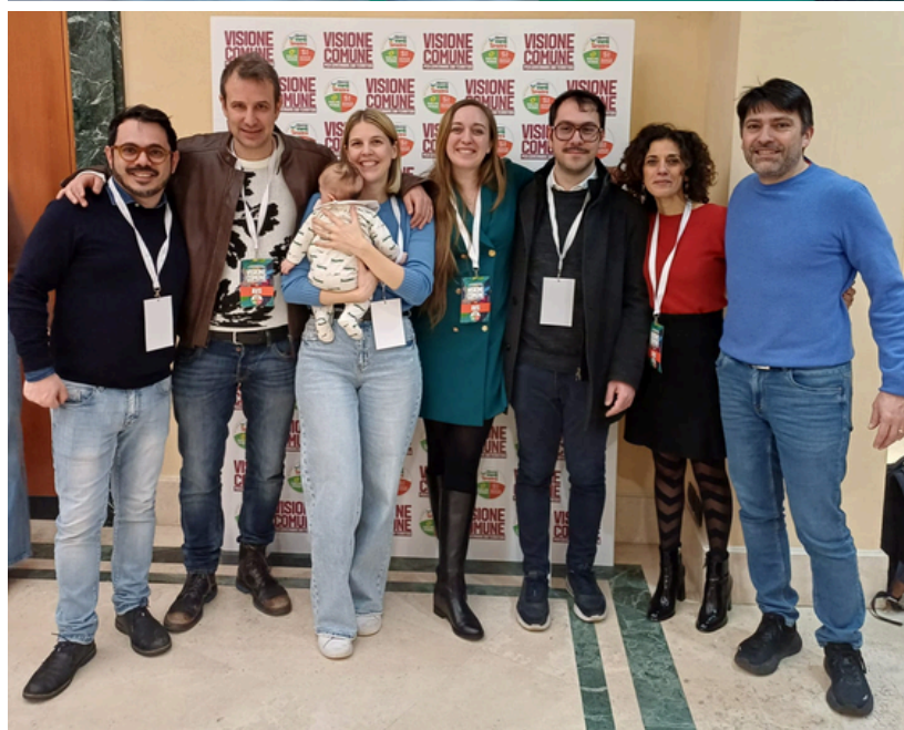
la delegazione veneta di Alleanza Verdi-Sinistra

Eppure, proprio nei territori, continuano a nascere e resistere esperienze di buon governo, scelte coraggiose e politiche innovative che migliorano concretamente la vita delle persone. È da qui che vogliamo ripartire. Ti aspettiamo questo fine settimana, insieme a migliaia di amministratori locali e nostri eletti, che come AVS credono in una visione diversa di Paese