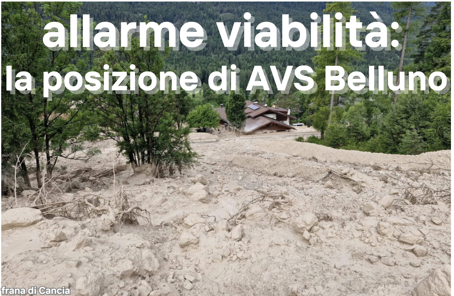
frana di Cancia