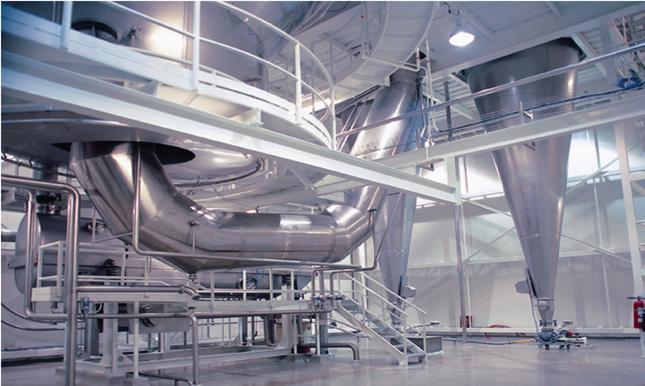
Cumple con la norma: NOM-008-ZOO-1994