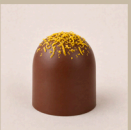
Bombom de limão siciliano