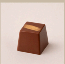
Bombom de caramelo salgado