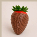
Morango banhado no chocolate