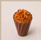
Doce de leite com coco queimado