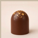
Bombom de maracujá