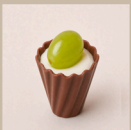
Copinho de uva