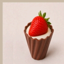
Copinho de morango