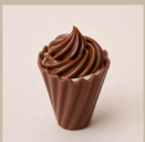
Ninho com nutella