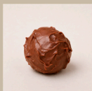
Bombom de uva