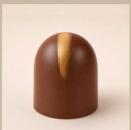
Bombom de frutas vermelhas