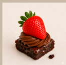
Brownie com morango