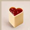
Coração de geleia de morango