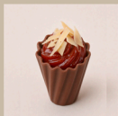
Romeu e julieta