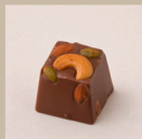
Snack de castanhas