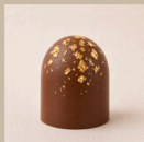
Bombom de beijinho