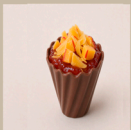
geleia de morango com queijo do reino