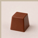
Bombom de ovomaltine