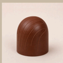
Bombom de brigadeiro belga