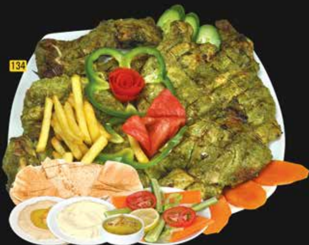
134 دجاج على الفحم تشيلي أخضر Green Chilli Chicken Charcoal