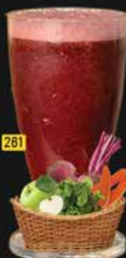
إيرن بوستر Iron Booster AED. 12.50