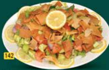
142 سلطة فتوش Fattoush Salad AED. 10.50