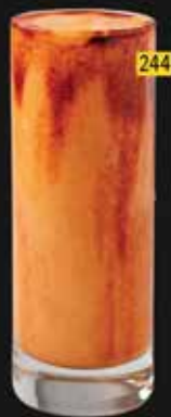
كوكتيل Cocktail AED. 12.50