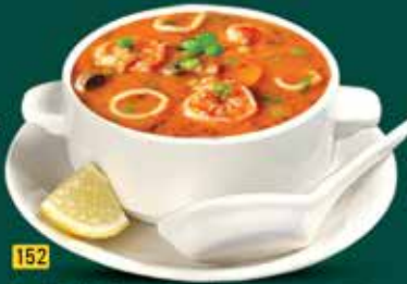
152 شورية بحرية خاصة شيف Chef Sp. Seafood Soup AED. 10.50