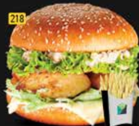
218 برجر دجاج ليمون Chicken Lemon Burger AED. 10.00