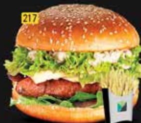
217 برجر دجاج تكا Chicken Tikka Burger AED. 10.00