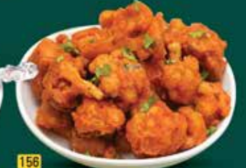
156 جوبي جاف مقلي Gobi Dry Fry AED. 10.00