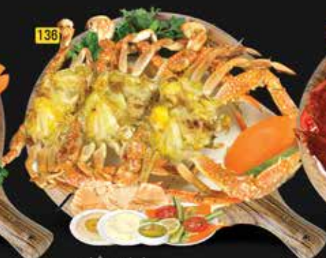
136 كراپ مشاوي Grilled Crab