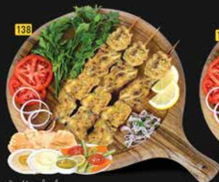
138 شيش طاووق Sheesh Tawook