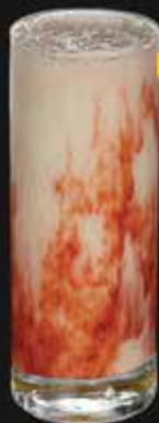
عصير موز Banana Juice AED. 8/10