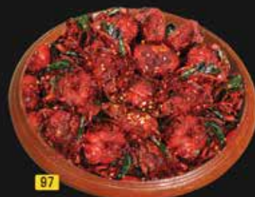
لحم فراتياتو Mutton Varattiyathu AED. 18.00