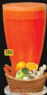
باور بوستر Power Booster AED. 12.50