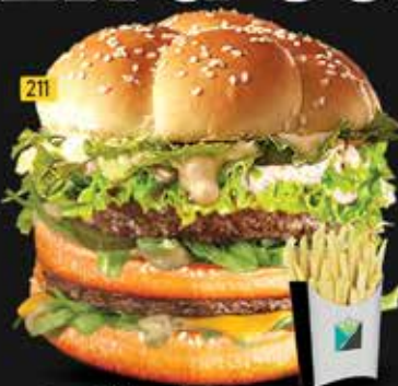
211 برجر دبل دجاج / لحم بقرى Double Burger Chi./Beef AED. 14.00