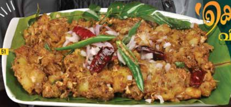
കാപ്താ ബിരയാണി / لحم بقري Kappa Biryani Chicken/Beef