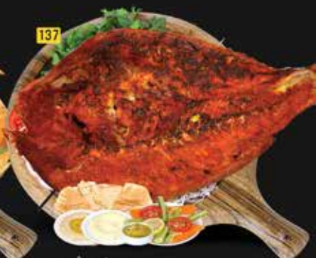
137 سمك مشاوي Grilled Fish