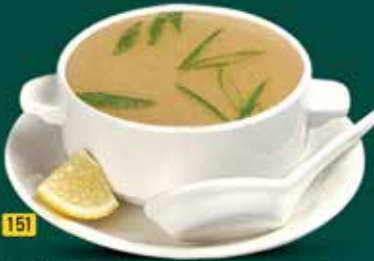
151 شورية صافي خضار / دجاج Clear Soup Veg./Chi. AED. 10.50