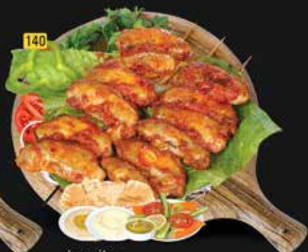
140 جوانح دجاج Chicken Wings