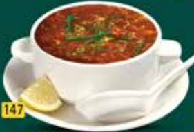
147 خضار / دجاج حار وحمض Hot N Sour Veg./Chi. AED. 8.5/10.5