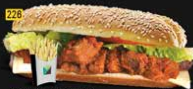
226 كومبو تشيلى / نقانق Chilli/Hotdog Combo AED. 06/07