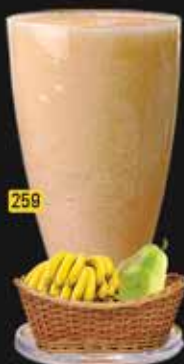
عصير سالفيشن Juice Salvation AED. 12.50

Indian cuisine consists of a variety of regional and traditional cuisines native to India. Given the diversity in soil, climate, culture, ethnic groups, and occupations, these cuisines vary substantially and use locally available.