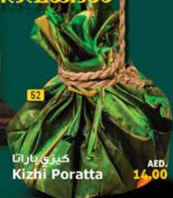
കിഴി പരത്ത Kizhi Poratta