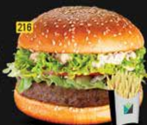
216 برجر لحم بقرى خاص Special Beef Burger AED. 8.00