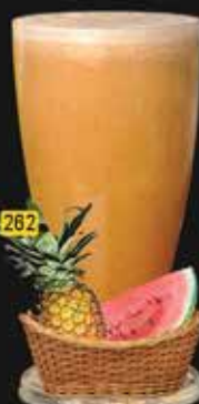
رابيد ريكوفاري Rapid Recovery AED. 12.50