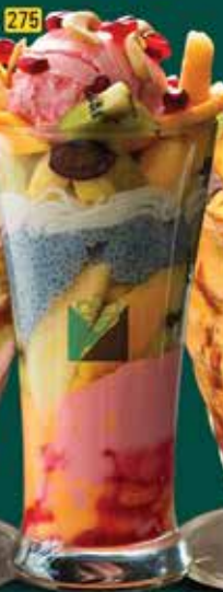
فالودة خاصة Special Falooda AED. 12.5/15