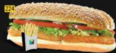
224 كومبو دجاج فيليه Chi. Fillet Combo AED. 10.00