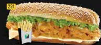
221 كومبو زنجر Zinger Combo AED. 10.00