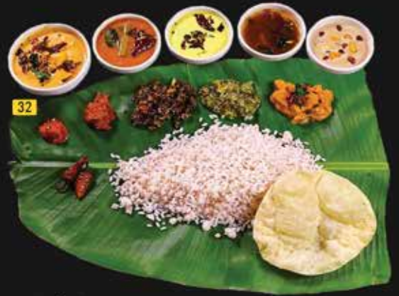
32 وجبات نادان Nadan Meals