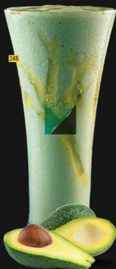
أفوكادو Avocado AED. 10.00/12.00