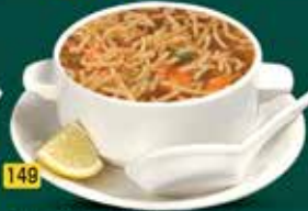
149 شورية مانشو خضار / دجاج Manchow Soup Veg./Chi. AED. 8.5/10.5