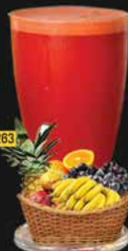
فيتامين لود Vitamin Load AED. 12.50