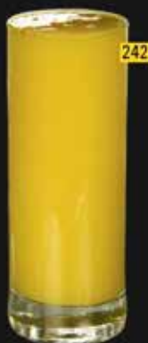
مانجو Mango AED. 10/12