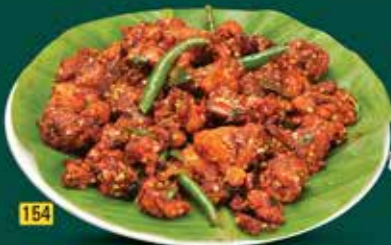
154 كونجي كوزي مولاكيديشاتو Kunji Kozhi Mulakidichathu AED. 28.00