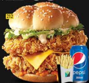
212 زنجر برجر العملاق Mega Zinger Burger AED. 18.00