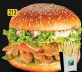
213 برجر زنجر Zinger Burger AED. 12.00