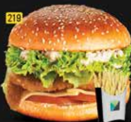
219 برجر فيليه Fillet Burger AED. 10.00