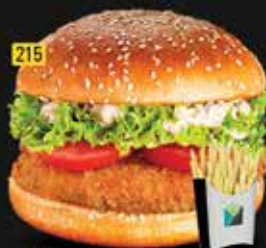
215 برجر دجاج خاص Special Chi. Burger AED. 8.00