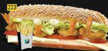
223 كومبو بتر فلاى Butterfly Combo AED. 13.00