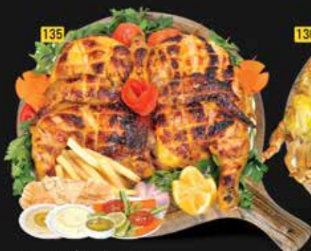
135 دجاج على الفحم عادي Normal Chicken Charcoal