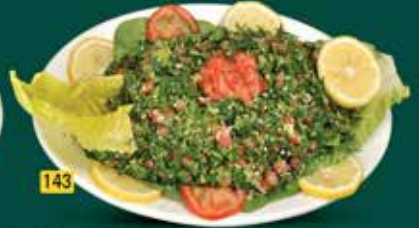
143 سلطة تبولة Tabbouleh Salad AED. 10.50