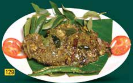
سمك مانجو تشاتتي كاري Fish Mango Chutty Curry Seasonal