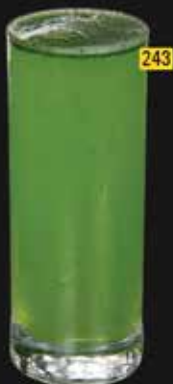
ليمون نعناع Lemon Mint AED. 8.5/10.5