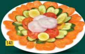
141 سلطة أخضر Green Salad AED. 10.00