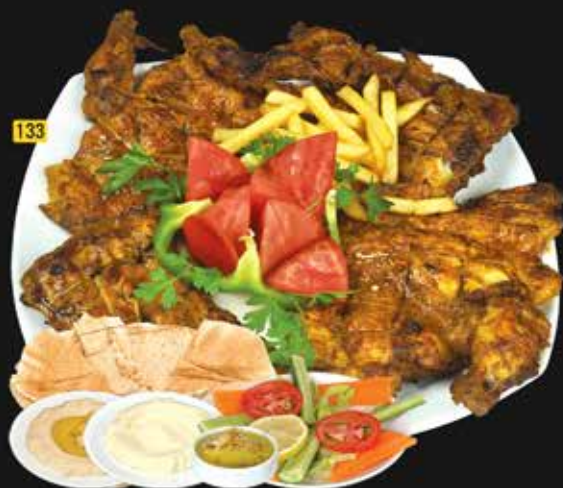
133 دجاج على الفحم فلفل Pepper Chicken Charcoal

Indian cuisine consists of a variety of regional and traditional cuisines native to India. Given the diversity in soil, climate, culture, ethnic groups, and occupations, these cuisines vary substantially and use locally available.