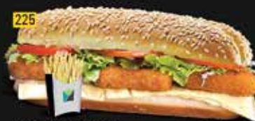
225 كومبو قطع دجاج Chi. Nuggets Combo AED. 10.00