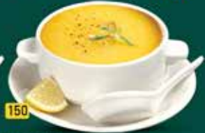
150 دال شوربا Dal Shorba AED. 10.50