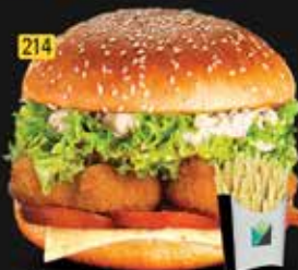
214 برجر قطع دجاج Chi. Nuggets Burger AED. 10.00