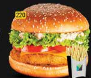
220 برجر خضار خاص Special Veg. Burger AED. 8.00