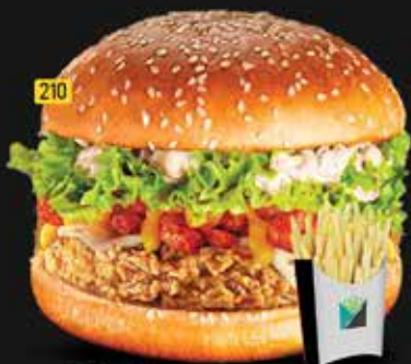
210 برجر زنجر شيتوس Zinger Cheetos Burger AED. 18.00