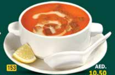
153 شورية كريمه خضار / طماطم / مشروم / دجاج Cream Soup Veg./Tomato/Mushroom/Chi. AED. 10.50