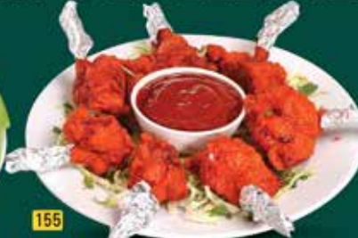
155 دجاج لوليبوب Chicken Lollipop AED. 15.00