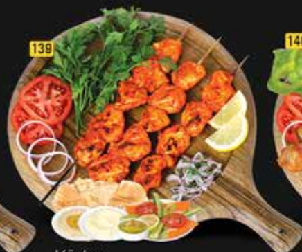
139 دجاج تكا Chicken Tikka