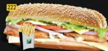
222 كومبو دجاج ليمون Chi. Lemon Combo AED. 10.00