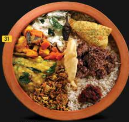
31 تشاتي تشورو Chatti Choru