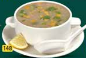
148 خضار / دجاج حار وحمض Sweet Corn Veg./Chi./Prawns AED. 8.5/10.5/10.5