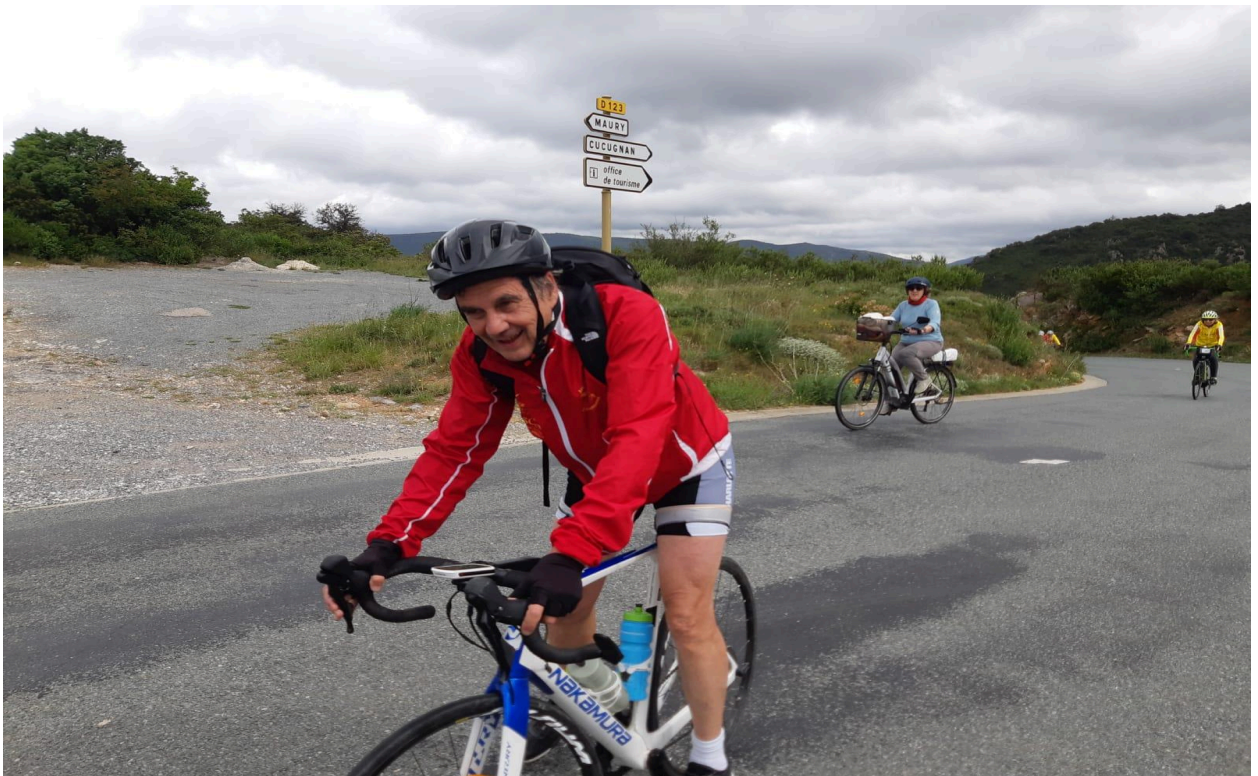
PG] | [Photo : RCBYE4539.JPG]