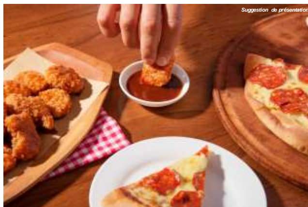
Suggestion de présentation