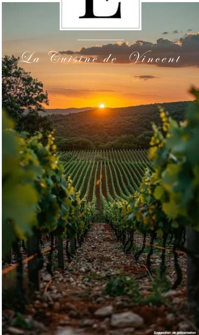
Suggestion de présentation