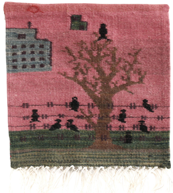
Los testigos , 2023 Tapiz de lana teñida con tintes naturales. 22 x 22 cm 750 USD