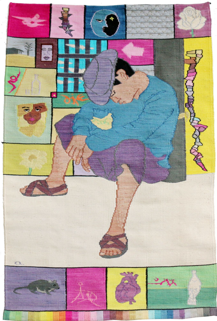
Sueños reales , 2020 Gobelino tejido con lana y algodón teñido con anilinas 100 x 65 cm 2600 USD