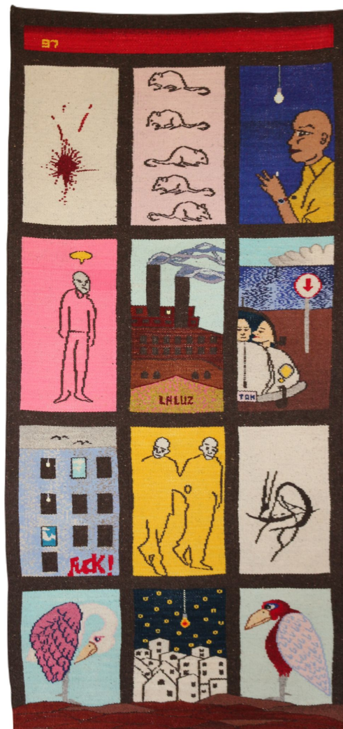
Las iras y los miedos , 1997 Tapiz de lana teñida con anilinas. 141 x 64 cm 2625 USD