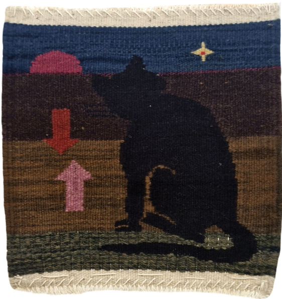
Luna roja, 2022

Tapiz de lana teñida con tintes naturales y tejida con diversas técnicas textiles.