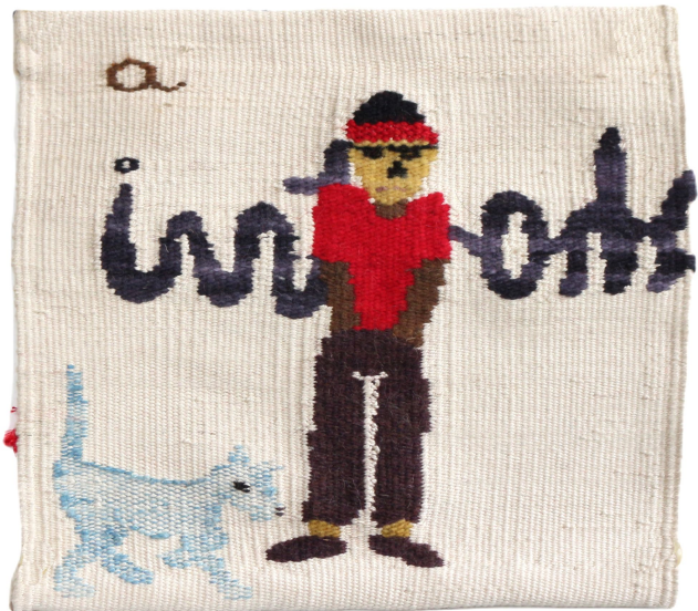
Bato , 2023 Tapiz de lana teñida con tintes naturales y tejida con diversas técnicas textiles. 18 x 21 cm 750 USD