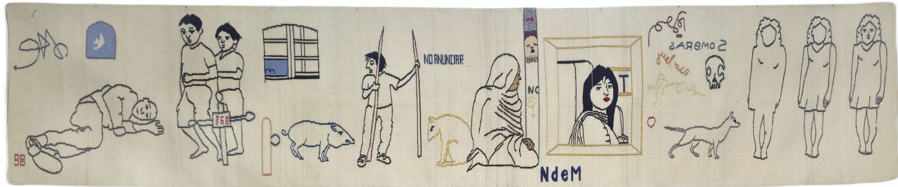
Express del diario , 1998 Técnica mixta, algodón y seda teñidos con colores sintéticos. 216 x 43 cm 3375 USD