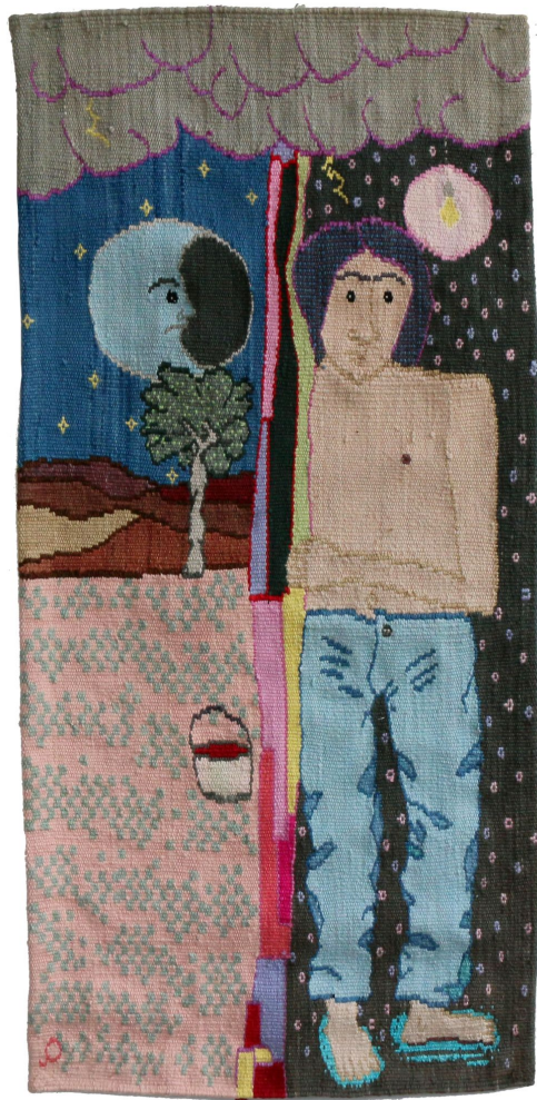
Noche en do mayor , 2020 Gobelino tejido con lana y algodón teñido con anilinas 74 x 35 cm 2250 USD