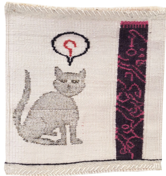
Ora pa dónde, 2022

Tapiz de lana teñida con tintes naturales y tejida con diversas técnicas textiles