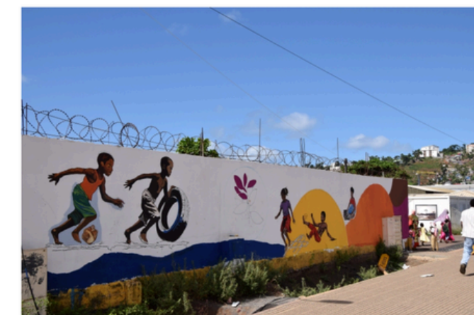
Les dessins ont été réalisés directement par les jeunes de Kawéni