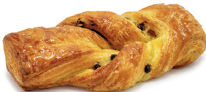
COD: GRANZ GRANZELLA CREMA E GOCCE DI CIOCCOLATO prelievitato pasta sfoglia crema e gocce di cioccolato