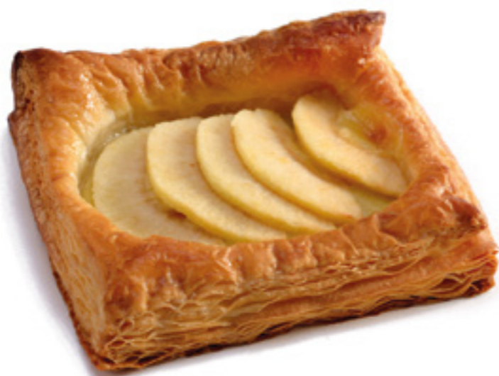
COD: SFOMEL SFOGLIA MELA E CREMA pasta sfoglia mela e crema