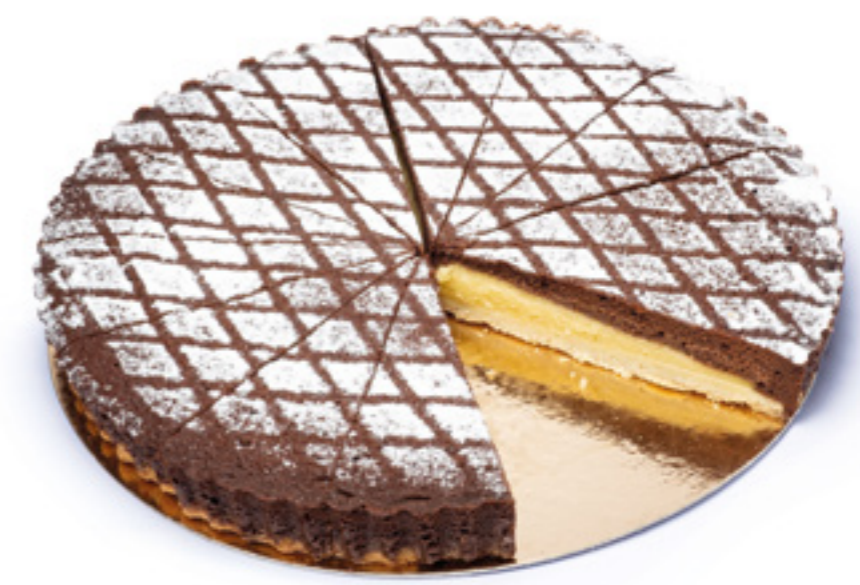
COD: TTORCIO TORTA AL CIOCCOLATO pasta frolla, crema pasticcera e cake cioccolato