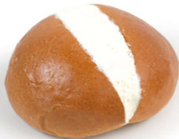
COD: MRTZ01 MARITOTZO PANNA E CREMA già cotto