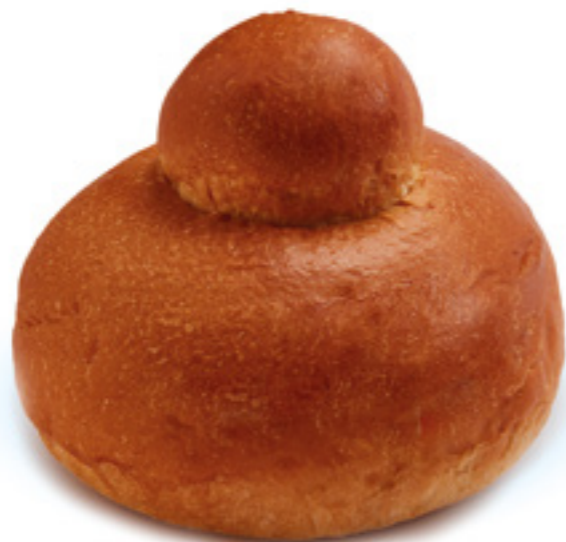
COD: 40BRI BRIOCHES SICILIANA già cotta