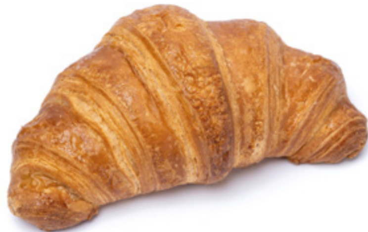
COD: SIC80 CORNETTO SICILIA 80 da lievitare melange al burro