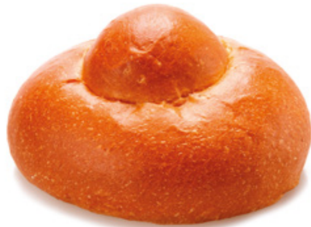
COD: 120GRA BRIOCHES SICILIANA da lievitare