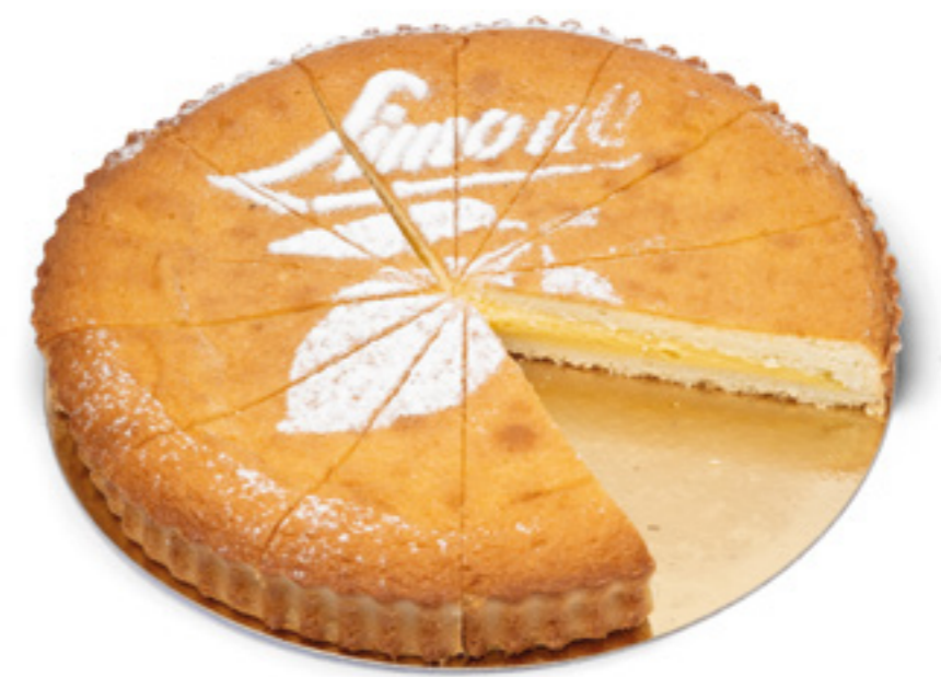
COD: TTORLIM TORTA AL LIMONE pasta frolla e crema di limone - cake limone