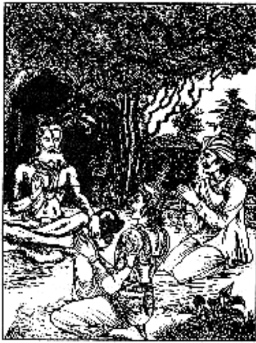
ऋषिरुवाच ॥ ४६ ॥

ज्ञानमस्ति सपस्तस्य जन्तोर्विषयगोचरे ॥ ४७ ॥ विषयश्च महाभाग याति चैवं पृथक् पृथक् । दिवाग्धाः प्राणिनः केचिद्रात्राग्धास्तथापरे ॥ ४८ ॥ केचिद्दिवा तथा रात्रौ प्राणिनस्तुत्वदृष्टयः । ज्ञानिनो मनुजाः सत्यं किं तु ते न हि केवलम् ॥ ४९ ॥ यतो हि ज्ञानिनः सर्वे पशुपक्षिमृगादयः । ज्ञानं च तन्मनुष्याणां यत्तेषां मृगपक्षिणाम् ॥ ५० ॥ मनुष्याणां च यत्तेषां तुत्वमन्यतथोभयोः । ज्ञानेऽपि सति पश्येतां पतङ्गाञ्छावचञ्चुषु ॥ ५१ ॥ कणामोक्षाद्गुताग्नाहोत्वीड्यमानानपि क्षुधा । मानुषा मनुजव्याघ्र साभिलाषाः सुतान् प्रति ॥ ५२ ॥ लोभात्प्रत्युपकाराय नन्वेतान् किं न पश्यसि । तथापि ममतावर्ते मोहगर्ते निपातिताः ॥ ५३ ॥ महामायाप्रभावेण संसारस्थितिकारिणो । तत्रात्र विस्मयः कार्यो योगनिद्रा जगत्पतेः ॥ ५४ ॥ महामाया हरेर्श्रेष्ठा तथा संमोह्यते जगत् । ज्ञानिनामपि चेतांसि देवी भगवती हि सा ॥ ५५ ॥