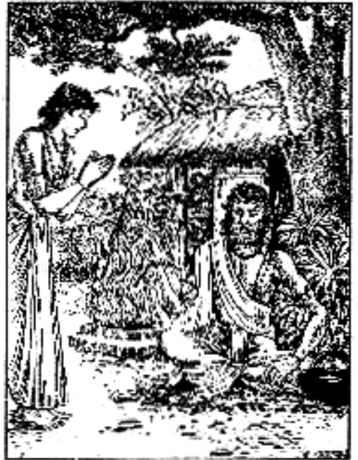
गुरुकी यह आज्ञा पाकर जब शान्ति नामक

सदा संलग्न रहनेवाले, सदाचारी और उदार शिष्य पुनित्वर शान्तिते कहा—'वत्स! मैं अपने भाई सुवर्चिके यज्ञमें जाऊँगा। उन्होंने मुझे बुलाया है। तुम्हें यहाँ आश्रमपर रहना है। यहाँ तुम्हारे लिये जो कर्तव्य है, सुनो। मेरे आश्रमपर तुम्हें प्रतिदिन अग्निको प्रज्वलित रखना होगा और सदा ऐसा प्रयत्न करना होगा, जिससे अग्नि बुझने न पाये।'