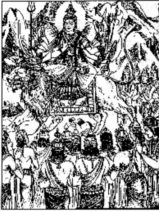
ब्रह्मिन्वाच ॥ ३८ ॥

इति प्रसादिता देवैर्जगतोऽर्थे तथाऽऽत्मनः । तथेत्युक्त्वा भद्रकाली बभूवान्तर्हिता नृप ॥ ३९ ॥ इत्येतत्कथितं भूप सम्भूता सा यथा पुरा । देवी देवशरीरिभ्यो जगत्त्रयहितैषिणी ॥ ४० ॥