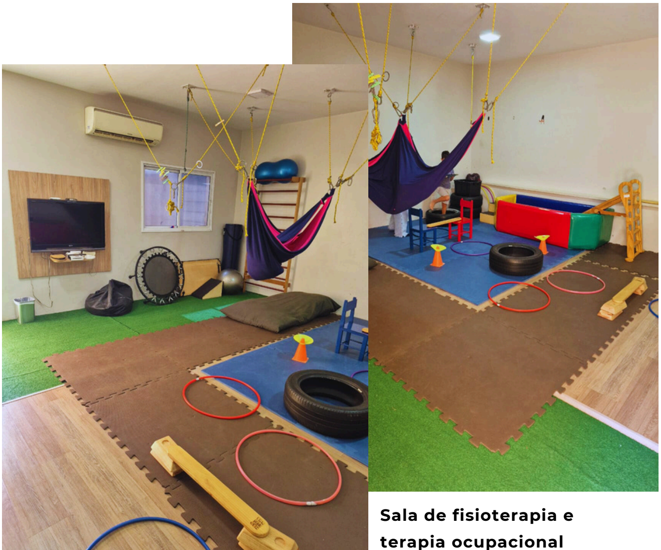
Sala de fisioterapia e terapia ocupacional

A fisioterapia acompanha o desenvolvimento motor global, estimulando força, coordenação, equilíbrio e postura. Isso garante que a criança tenha movimentos mais funcionais, seguros e que possa explorar o ambiente de forma ativa, essencial para seu crescimento.