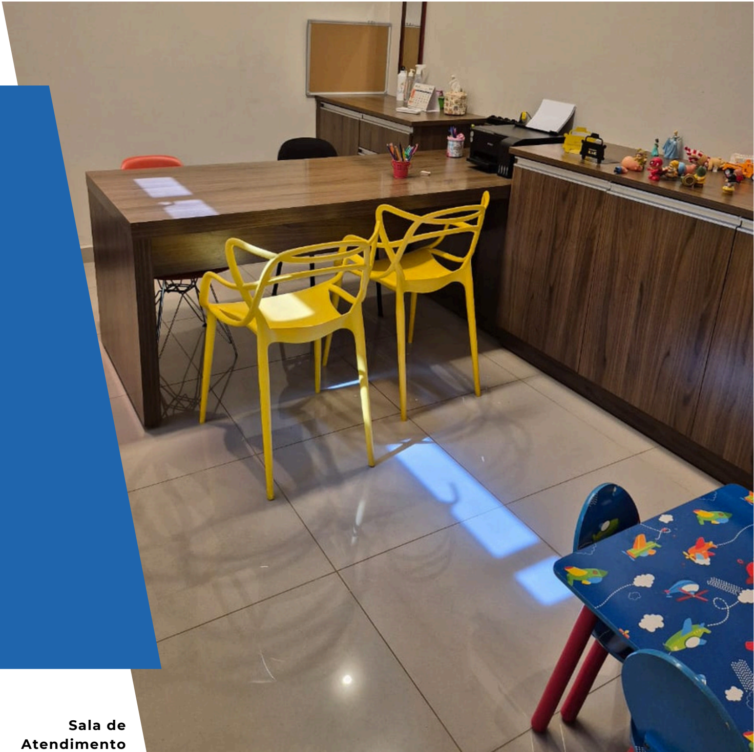
Sala de Atendimento