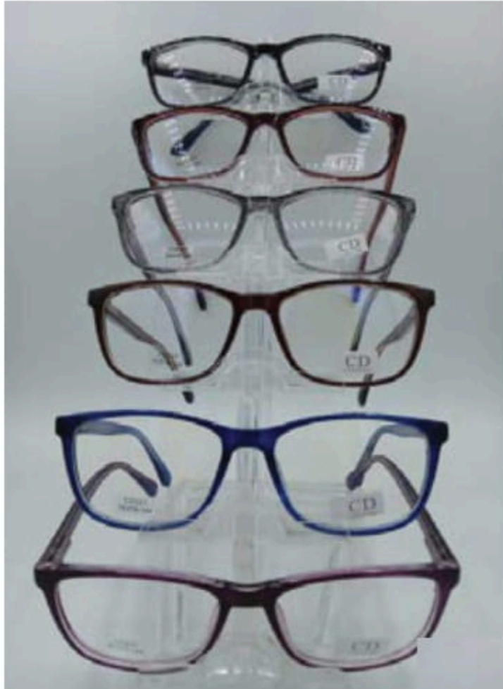
CD 227 flex y varilla

Si requiere factura, favor de considerar el 16% de I.V.A.