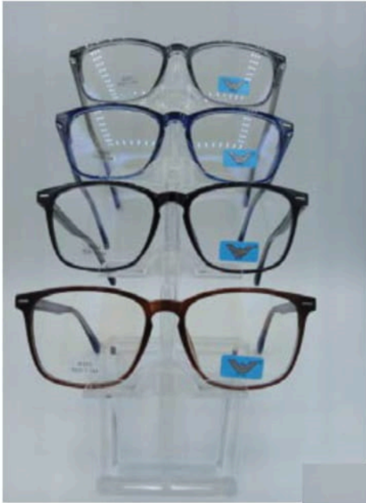
w 200 flex y varilla

Si requiere factura, favor de considerar el 16% de I.V.A.