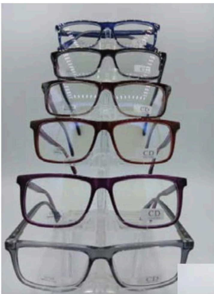
CD 229 flex y varilla