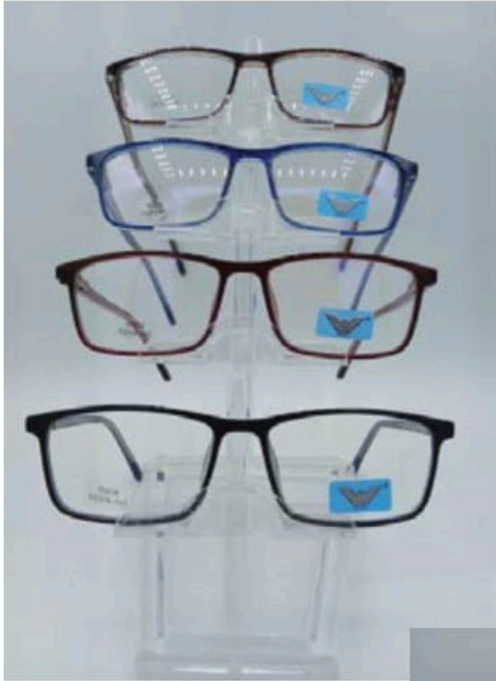
w 204 flex y varilla

Si requiere factura, favor de considerar el 16% de I.V.A.