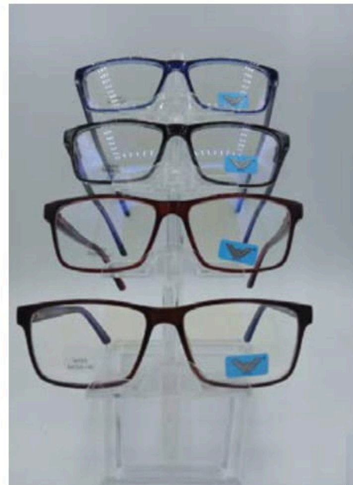
w 203 flex y varilla