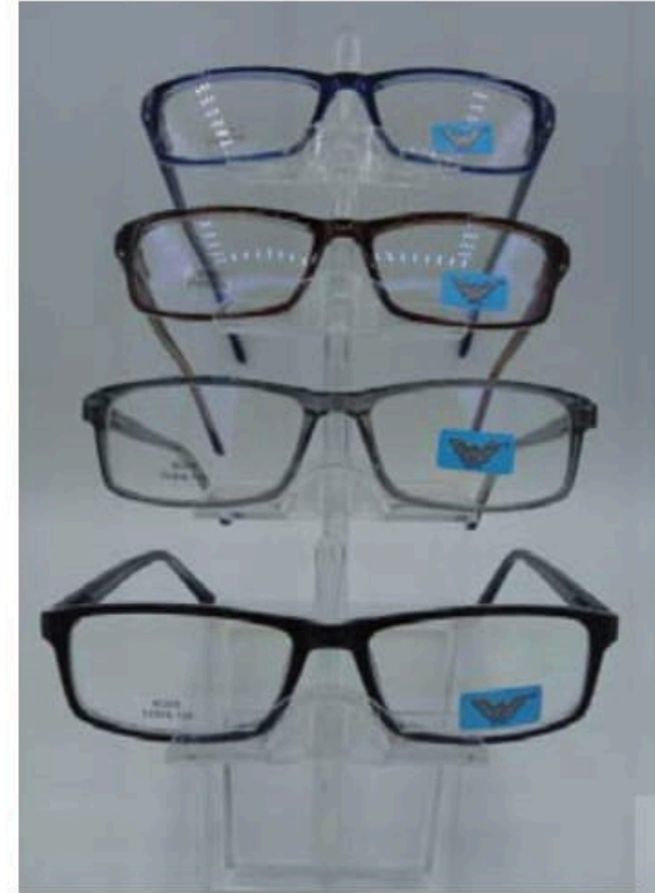
w 205 flex y varilla