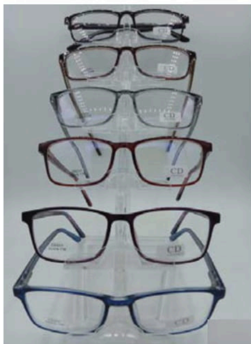
CD 223 flex y varilla

Si requiere factura, favor de considerar el 16% de I.V.A.