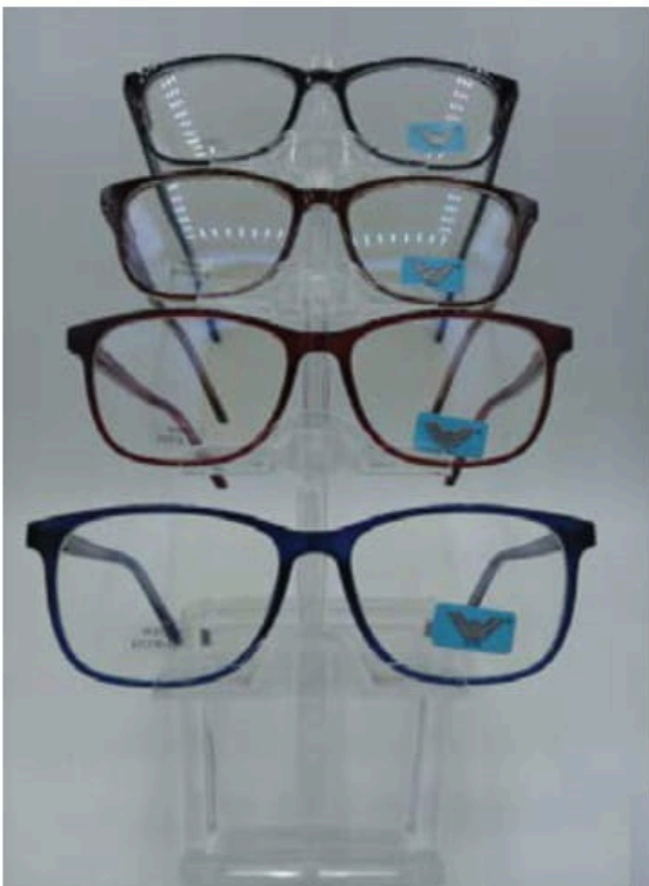
w 202 flex y varilla