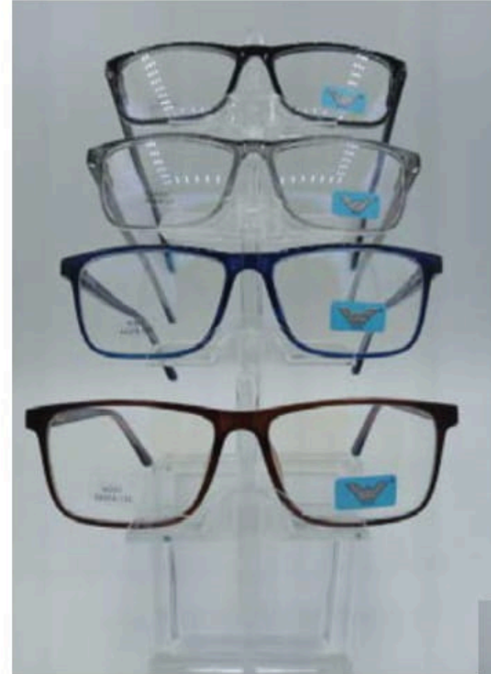
w 201 flex y varilla