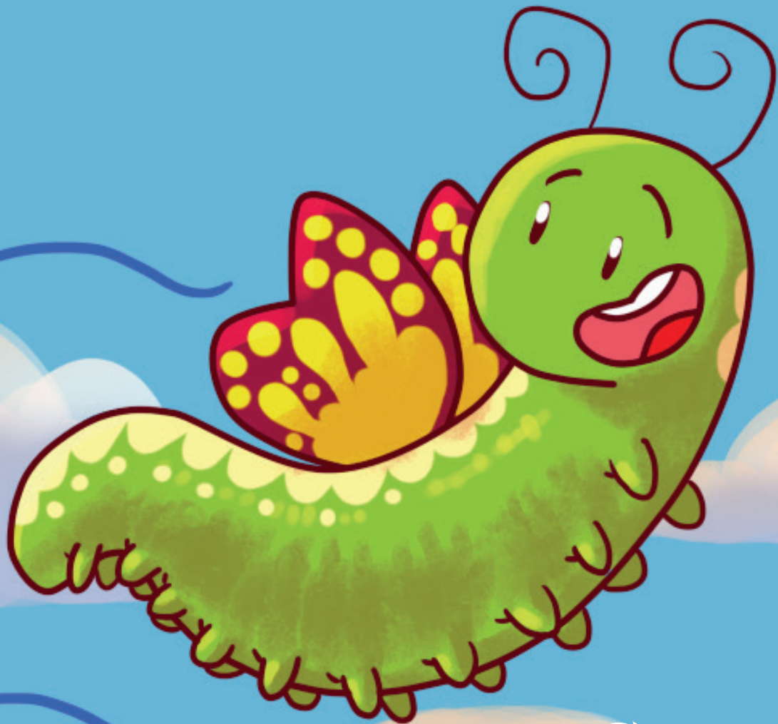
Ilustração Alexandre Mercês