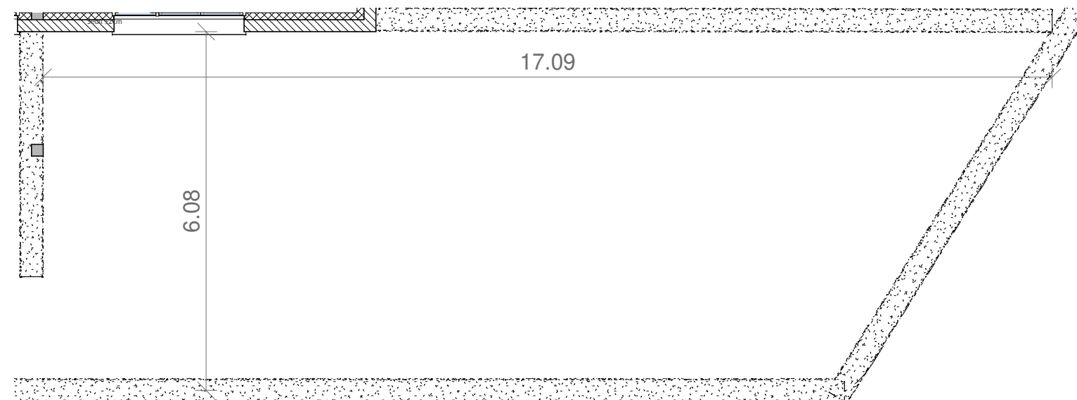
PLAN DU JARDIN

NOTA : La surface de ce plan est susceptible d'être légèrement modifiée en fonction des nécessités techniques de la réalisation en ce qui concerne les dimensions libres. Les équipements, canalisations et radiateurs ne sont pas figurés.