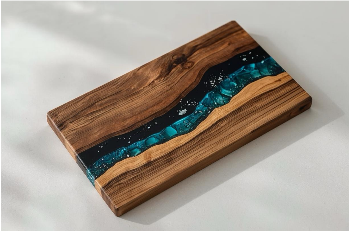
TABLA PARA SERVIR DE MADERA + RESINA

Une encanto rústico y brillo en este proyecto de tabla para servir de madera y resina. Es un diseño de nivel intermedio que combina carpintería práctica con resina fluida, y crea una pieza llamativa para charcutería, postres o decoración.