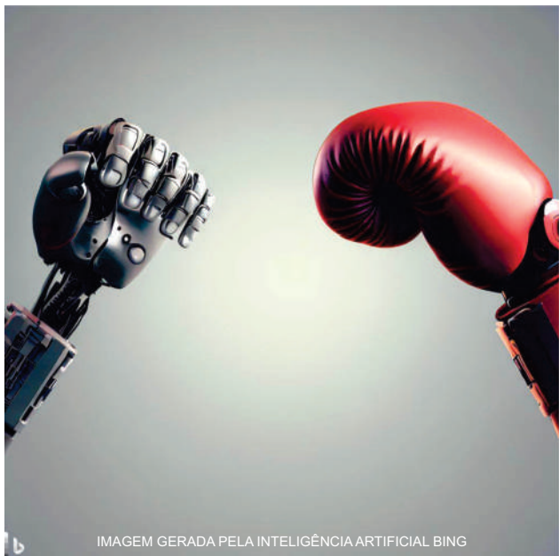
IMAGEM GERADA PELA INTELIGÊNCIA ARTIFICIAL BING

Em um mundo cada vez mais digital, nosso papel é encontrar esse equilíbrio e deixar um legado de uma vida digna, empática e participativa para as gerações futuras.