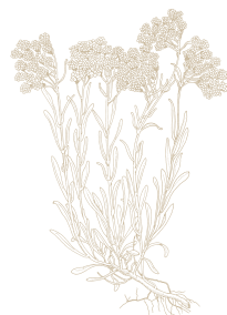
Elicriso ( Helichrysum italicum ) dal potere calmante e rinfrescante