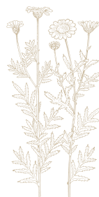
Camomilla dei tintori ( Anthemis tinctoria ) dal potere antiossidante

Da qui nasce una miscela brevettata di estratti vegetali, risultato di una lunga ricerca scientifica tra Kemon, Vivacell Biotechnology (Denzlingen, Germania) e Università di Ferrara.