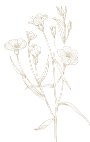
Lino ( Linum usitatissimum ) dal potere protettivo ed emolliente