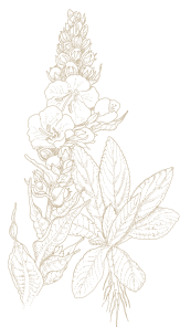
Verbascio ( Verbascum densiflorum ) dal potere lenitivo

Il Velian Complex deriva dalla combinazione di: