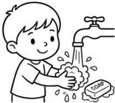
Lavado de Manos

Instrucciones: Observa las imágenes. Encierra en un círculo verde las acciones de prevención contra las enfermedades por calor. Tacha con una 'X' roja las que sean riesgosas. ¡Colorea tus respuestas!