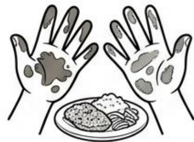
No Lavar Manos