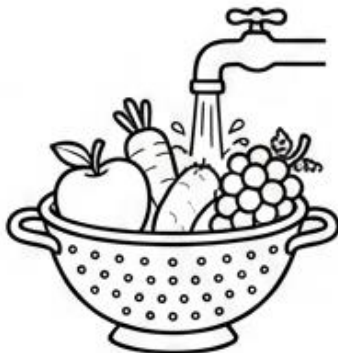
Lavado de Frutas y Verduras