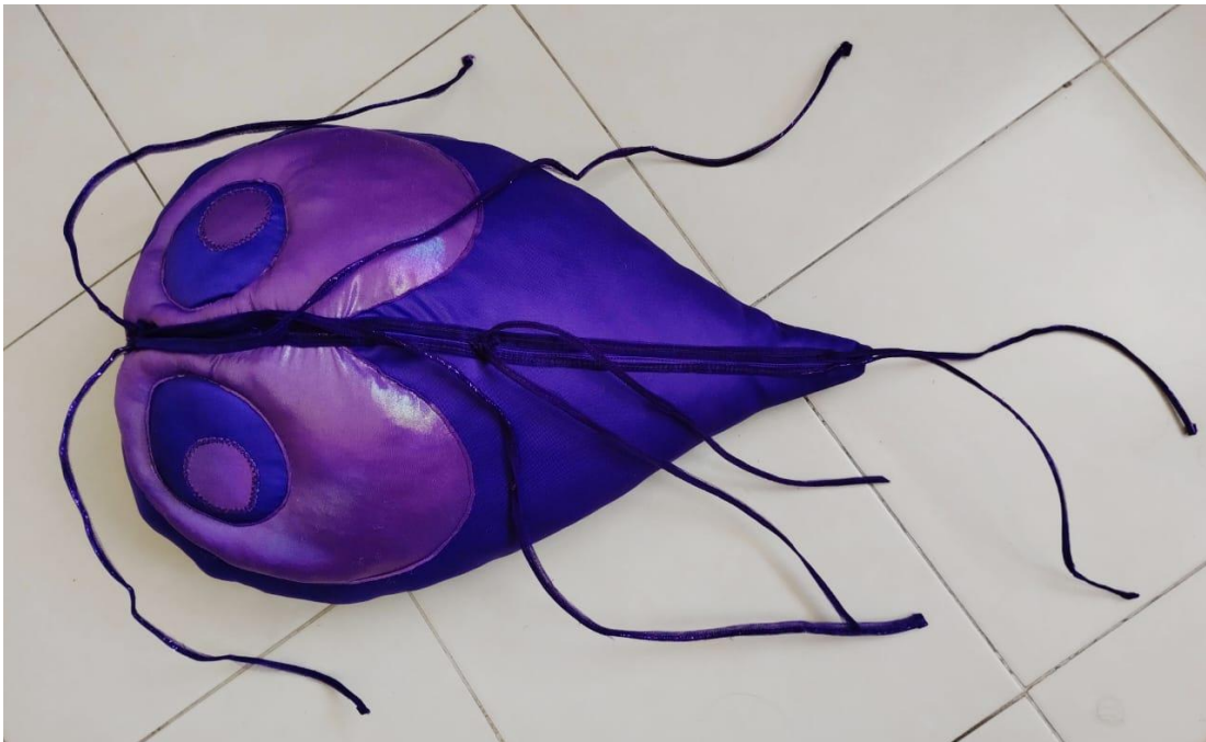
Modelo interactivo (peluche) de Giardia Lamblia