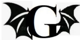
Grotesc, una epopeia gòtica de G.E. Graven