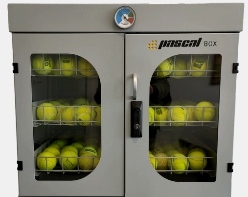
alto: 65cm - ancho: 65cm - fondo: 85cm