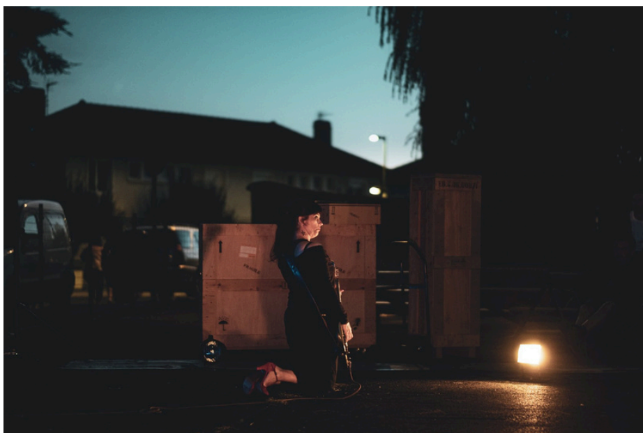
Container , création 2016, Festival Aurillac

Depuis 15 ans, elle travaille en tant que metteuse en scène (220 vols - Princesse Bernard / Chez ce cher Serge / 110% collectif / compagnie de l'Arpette / Cie Modula Médusa / Gorgomar), le plus souvent afin d'ouvrir les jeux et d'enrichir l'écriture, parfois problématique lorsque les disciplines abordées demandent beaucoup de technique. Elle collabore régulièrement avec Group'Berthe.