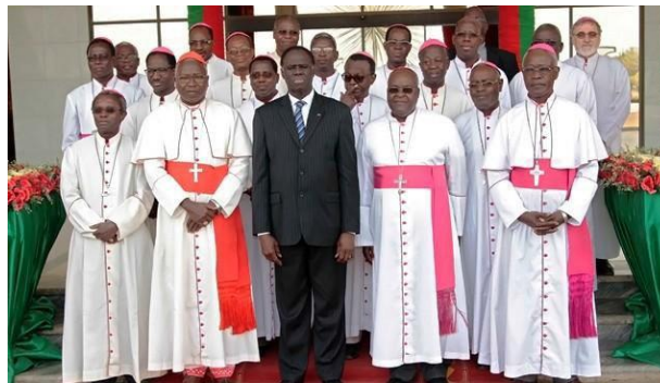
Photo n°2 : Le Président de la Transition, Michel Kafando, et les évêques du Burkina et du Niger