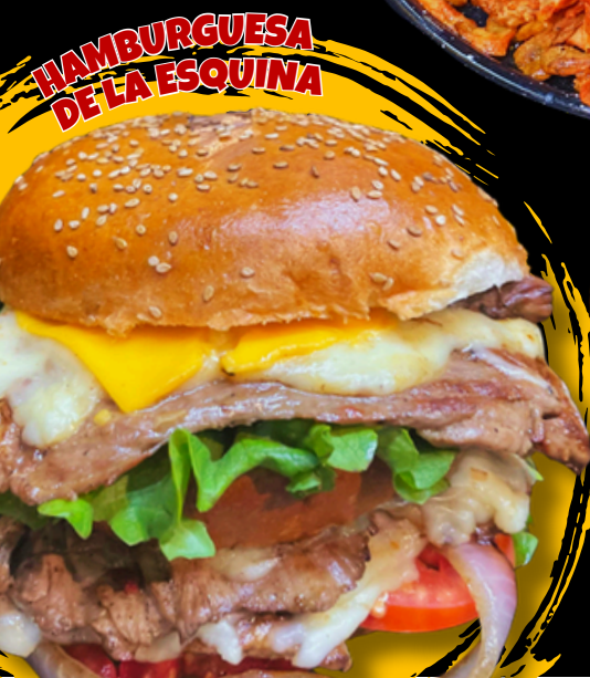
HAMBURGUESA DE LA ESQUINA