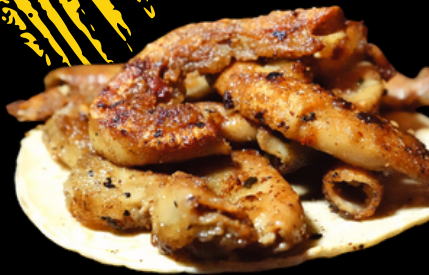
TACO DE TRIPA

AGREGA QUESO MANCHEGO A TU TACO POR SOLO 8