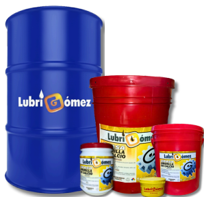
GRASA DE CALCIO COPAS