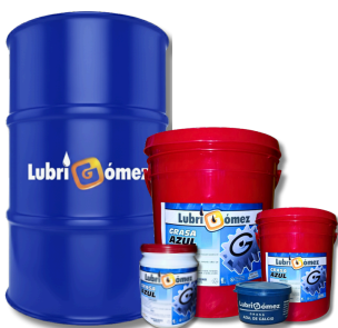
GRASA DE CALCIO AZUL