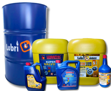
VALVULINA SAE 90 (API GL-1)