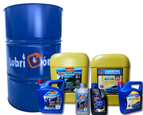
MOTOR HD-40, 50 Y 60