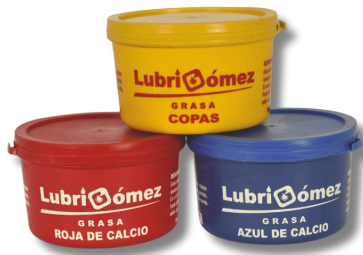
GRASA DE CALCIO