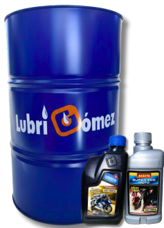
MULTIGRADO SAE 4T-20W50