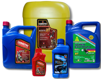
LÍNEA 2 TIEMPOS (MOTOS)