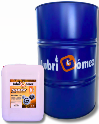
VALVULINA PARA TRAPICHE SAE 250 (API GL-1)