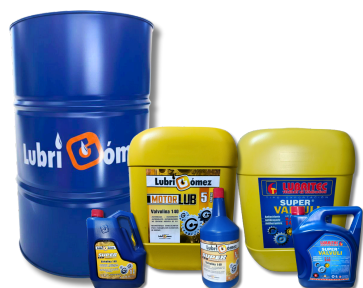
VALVULINA SAE 140 (API GL-1)