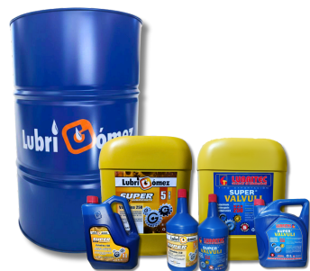
VALVULINA SAE 250 (API GL-1)