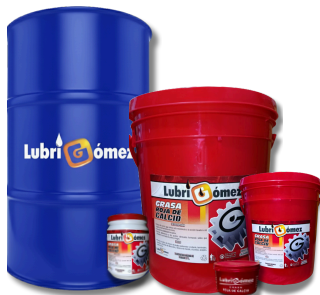
GRASA DE CALCIO ROJA