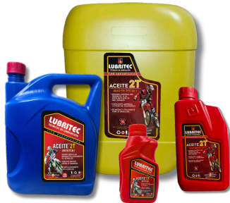
ACEITE 2T JASO FB TFC 30-1