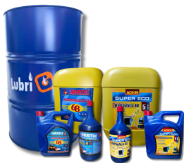
HIDRÁULICO ISO 68