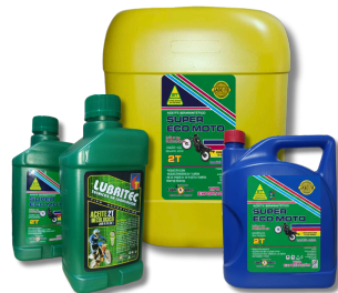
ACEITE 2T ECOLÓGICO JASO BF