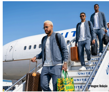
Próximo Compromisso Preparatório Contra o Egito

A escolha do Hotel The Ridge como local de hospedagem não foi por acaso. A comissão técnica buscou um ambiente que unisse o isolamento necessário para manter o foco dos atletas com a proximidade dos campos de treinamento e do aeroporto. Durante as próximas semanas, os jogadores passarão por uma rotina intensa de avaliações físicas, regeneração muscular após a longa temporada europeia e sessões de análise de vídeo dos adversários do grupo. A comissão técnica enfatiza que o sucesso em um torneio curto depende diretamente da excelência na preparação invisível, que envolve sono, nutrição adequada e estabilidade emocional de todo o grupo.