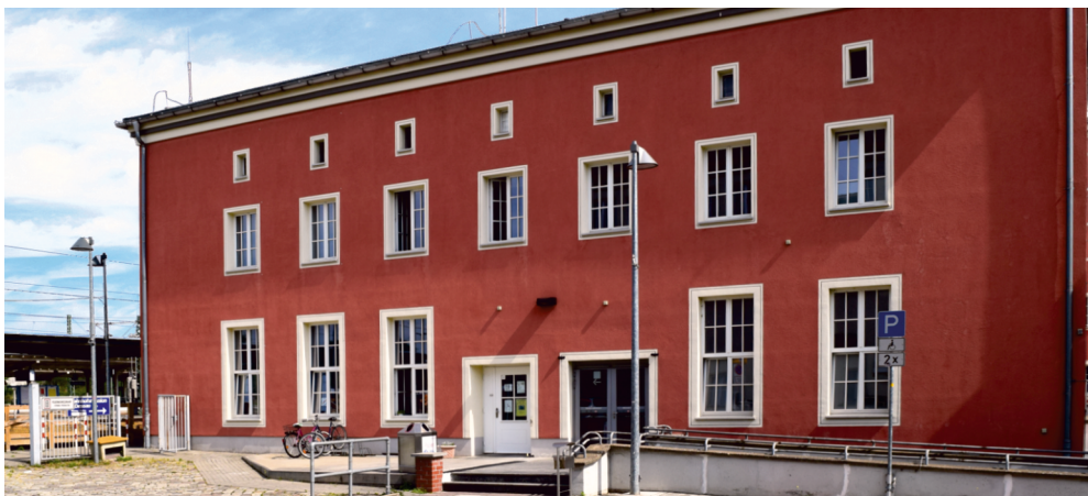
Bahnhofsgebäude Dessau inkl. Eingang der Bahnhofsmmission.

Die Arbeit der Bahnhofsmmission Dessau kann, trotz öffentlicher Zuwendungen, nicht ohne zusätzliche finanzielle Unterstützung geleistet werden. Darum sind wir stets auf Geldspenden aus der Bevölkerung und von wohlthätigen Organisationen angewiesen, da wir nur so die materielle Versorgung der Hilfesuchenden sicherstellen können.