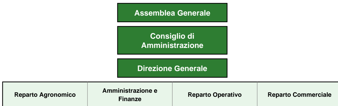
Figura 2. Organigramma di governo, direzione e reparti funzionali di COTABACO.

Questo modello organizzativo distingue chiaramente la sfera della rappresentanza e del governo cooperativo - affidata all'Assemblea Generale e al Consiglio di Amministrazione - dalla gestione ordinaria dell'organizzazione, svolta sotto la guida della direzione generale attraverso i reparti tecnico, amministrativo, operativo e commerciale.