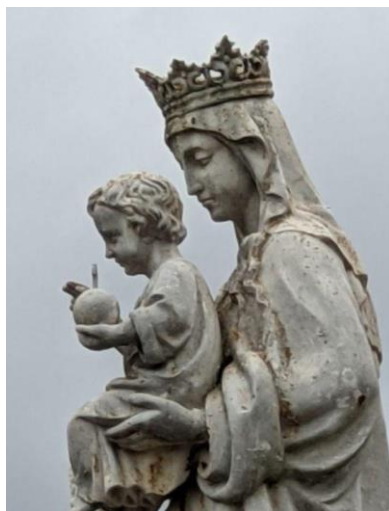
Statue Notre Dame des champs à Chevilly (1909, 2022)