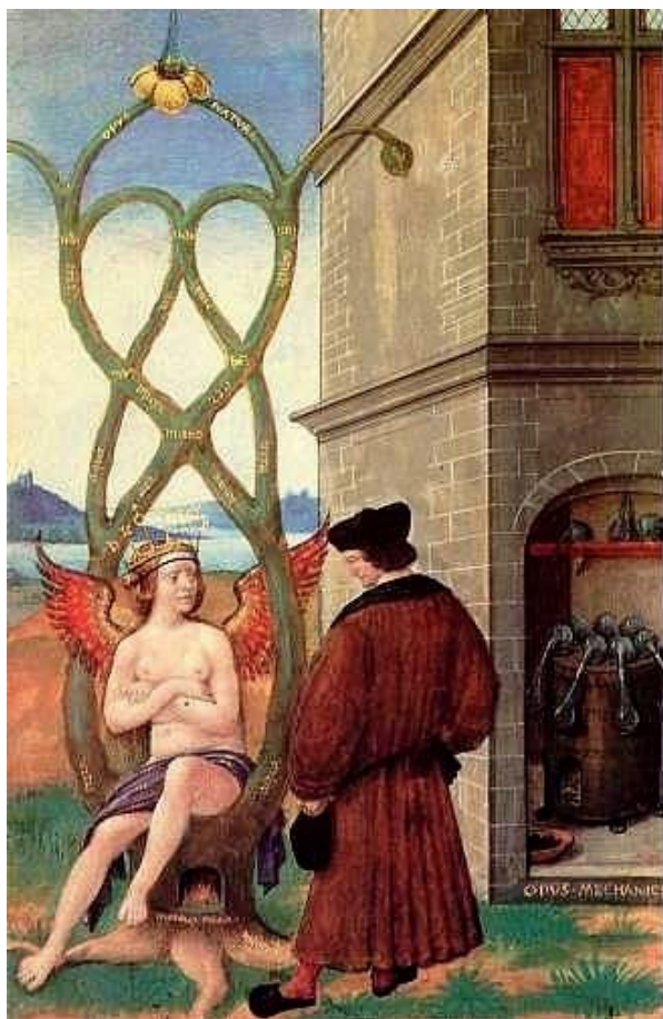
Miniature de Complainte à l'alchimiste errant - Jean Perréal (1516)

Restons encore un peu avec la miniature avant de quitter le poème. L'alchimiste regarde une femme, les hanches simplement couvertes d'un drap, les bras croisés sous ses seins. Elle a des ailes et une couronne portant les sept symboles des sept astres et des sept métaux. Elle est assise sur une souche d'arbre sous laquelle couve un feu. Au-dessus, les branches s'entremêlent comme un arbre de Séphiroth. Derrière, reflétant la clarté du ciel, un lac ou la mer s'immisce entre les îles. On aperçoit au loin une chapelle tendue vers le ciel et des ombres équivoques. L'alchimiste s'est détourné de son laboratoire sur le seuil duquel il est