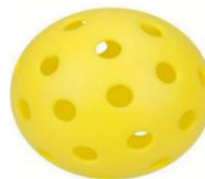
Pelota para exterior (figura B)