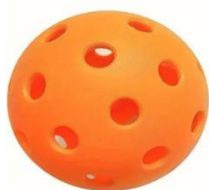
Pelota para interior (figura A)

3.- Construcción. La pelota deberá estar hecha de un material duradero moldeado con una superficie lisa y libre de texturas. La pelota será de un color uniforme, excepto por las marcas de identificación. La pelota puede tener una ligera protuberancia en la costura, siempre que no se afecte a las características de vuelo de la pelota. Ejemplos, la pelota puede ser de diferentes colores: