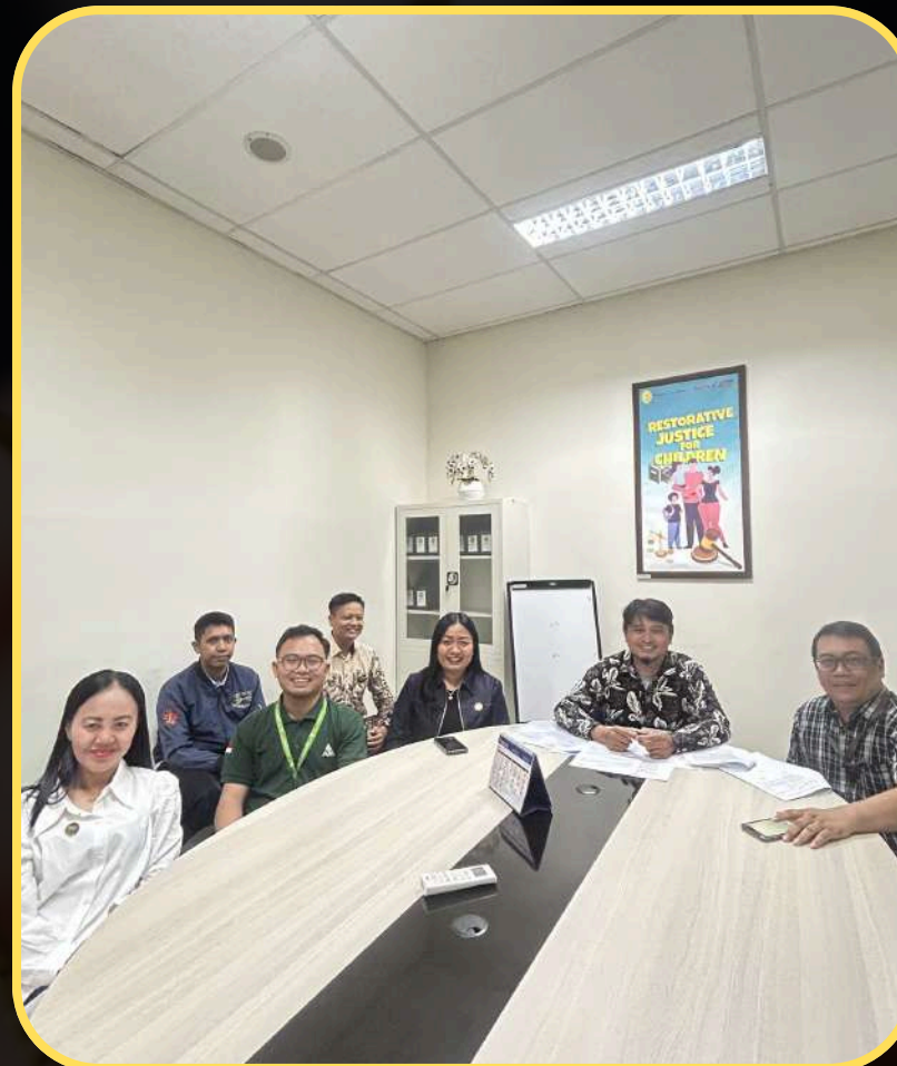
PENDAMPINGAN PROSES MEDIASI