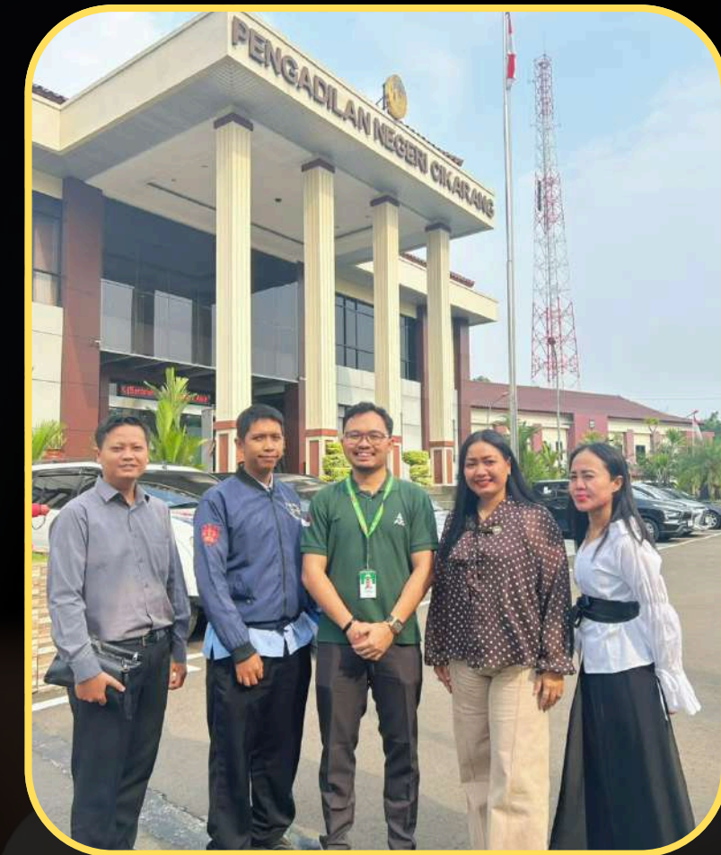
PENDAMPINGAN PROSES PERSIDANGAN