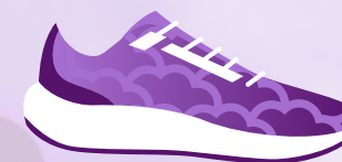
Baskets (modèle de base)