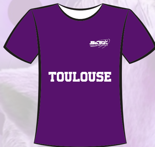
Maillot du club (fourni)