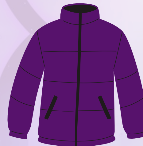
❄️ ☁️ Manteau / coupe vent