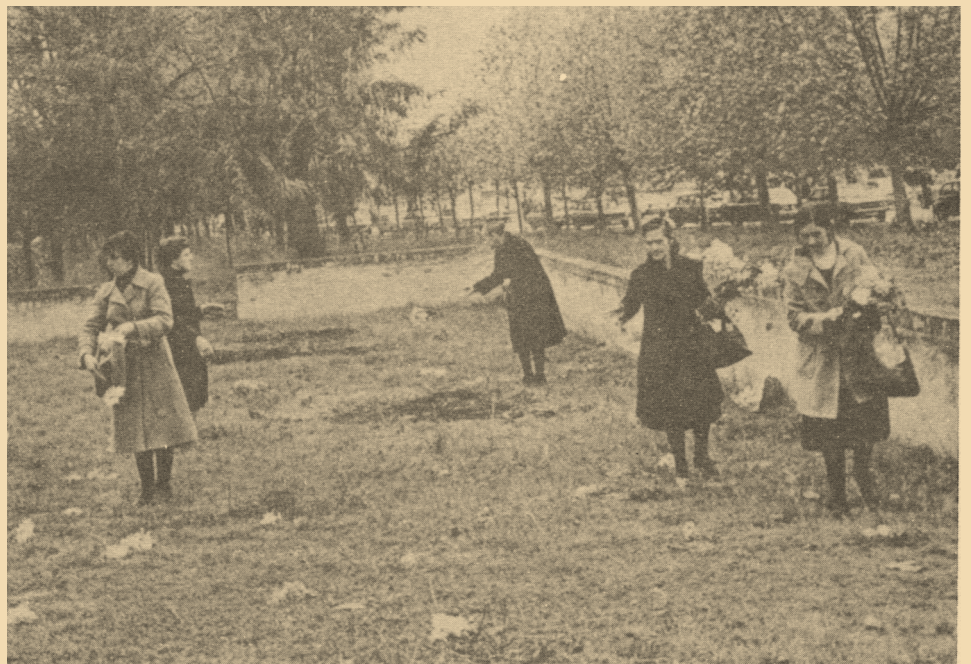
Viudas, hijas y madres riegan con flores el cementerio de Paracuellos del Jarama