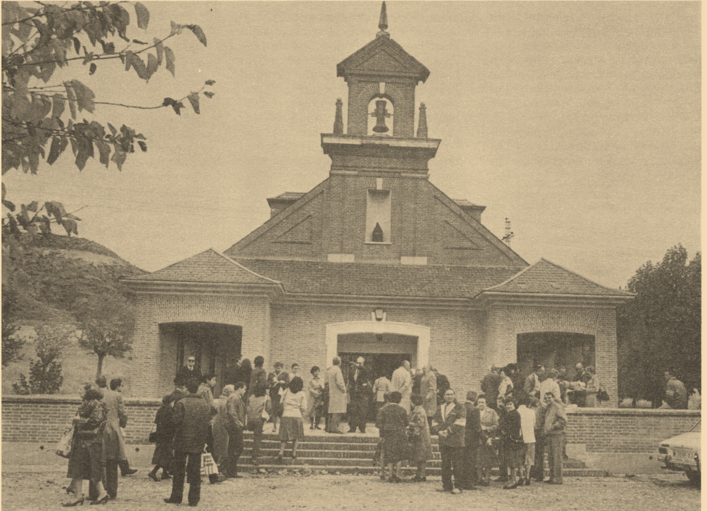
Capilla actual del Camposanto de Paracuellos del Jarama. En la hornacina la imagen de Ntra. Sra. de la Merced, Patrona de los Cautivos.