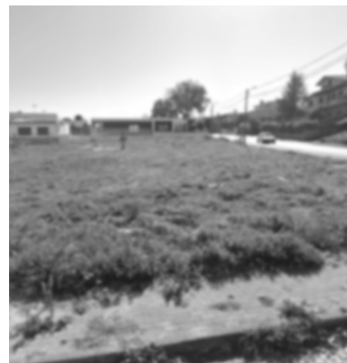
Casas de Vista Alegre Brevemente

Cada projeto que assinamos é um reflexo da nossa visão: aliar o melhor da arquitetura contemporânea à riqueza da identidade local, criando casas que não são apenas para morar, mas para viver com alma e autenticidade.