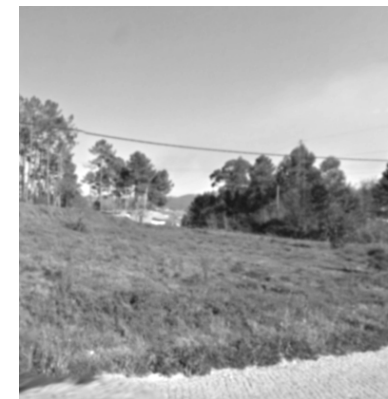
Casas do Alto Brevemente