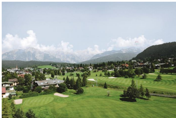
GOLFCLUB SEEFELD REITH

Somit ist er der perfekte Ort, um deine ersten Erfahrungen mit dem Golfsport zu machen!