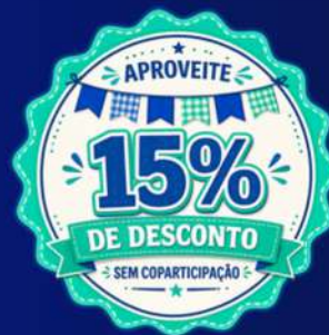
TABELA DE PREÇO PESSOA FÍSICA - PRAÇA DISTRITO FEDERAL