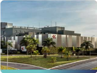
Hospital Santa Lúcia Sul

A Best Senior chega ao Distrito Federal estabelecendo um novo padrão de medicina de qualidade.