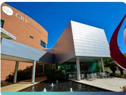
CBV Hospital de Olhos