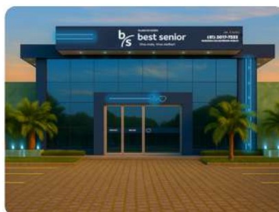
EM BREVE Clínica própria Best