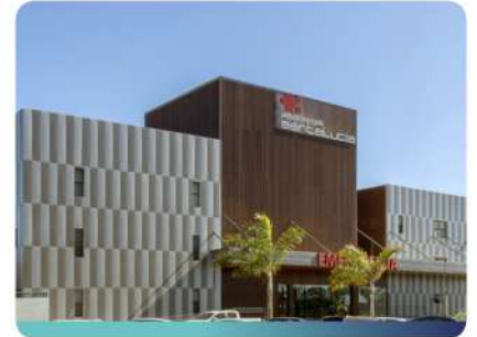
Unidade Avançada Santa Lúcia Taguatinga