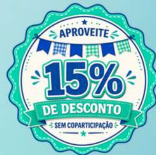
TABELA DE PREÇO PESSOA JURÍDICA ATÉ 99 VIDAS - PRAÇA DISTRITO FEDERAL