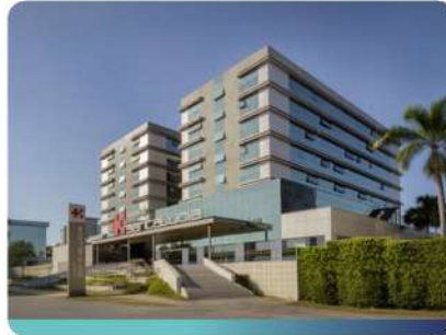
Hospital Santa Lúcia Norte