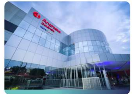
Hospital Anchieta Ceilândia