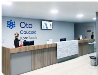
Unidade de Saúde Oto Caucaia