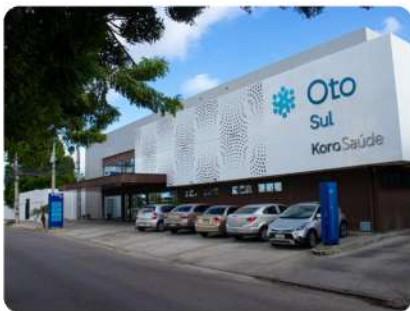
Pronto atendimento Oto Sul