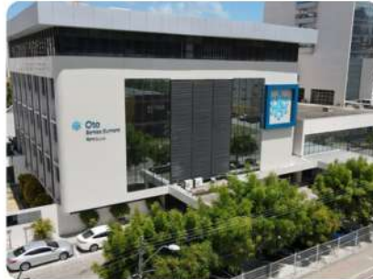
Hospital Oto Santos Dumont