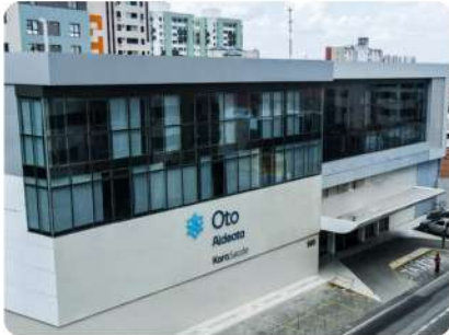
Hospital Oto Aldeota

A Best Senior chega ao Ceará estabelecendo um novo padrão de medicina de qualidade.