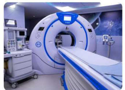
OtoLab Medicina Diagnóstica