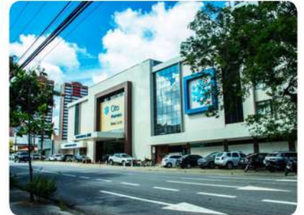
Hospital Oto Meireles