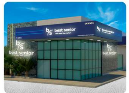
Sede própria Av. Desembargador Moreira, 1940, Aldeota, Fortaleza-CE