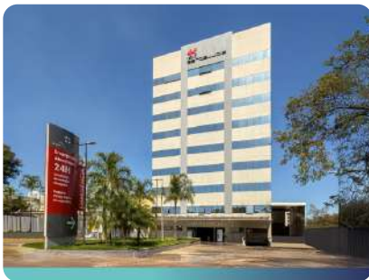
Hospital Santa Lúcia Gama