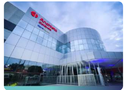
Hospital Anchieta Ceilândia