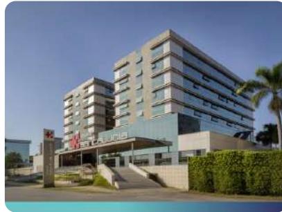
Hospital Santa Lúcia Norte