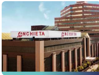
Hospital Anchieta Taguatinga