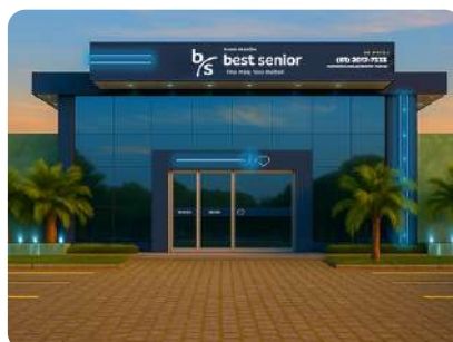
EM BREVE Clínica própria Best