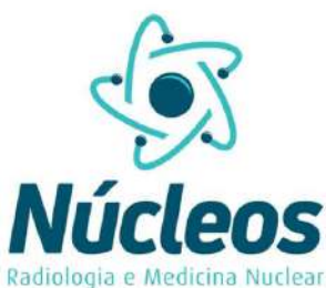
Núcleos Radiologia e Medicina Nuclear