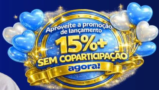
TABELA DE PREÇO PESSOA FÍSICA - PRAÇA DISTRITO FEDERAL