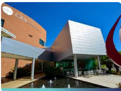
CBV Hospital de Olhos