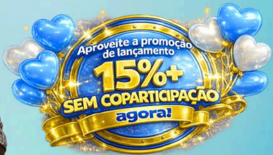
TABELA DE PREÇO PESSOA JURÍDICA ATÉ 99 VIDAS - PRAÇA DISTRITO FEDERAL