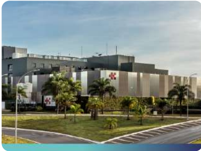
Hospital Santa Lúcia Sul

A Best Senior chega ao Distrito Federal estabelecendo um novo padrão de medicina de qualidade.