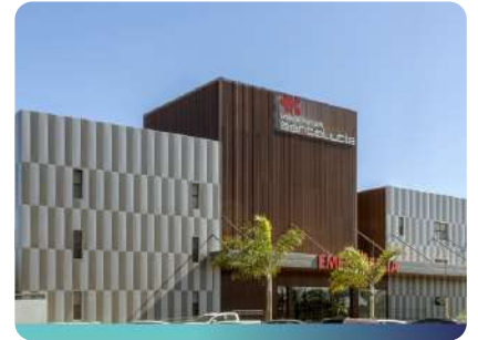
Unidade Avançada Santa Lúcia Taguatinga