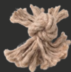
CORDE 1 NOEUD À PARTIR DE