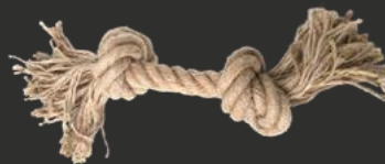
CORDE 2 NOEUD À PARTIR DE