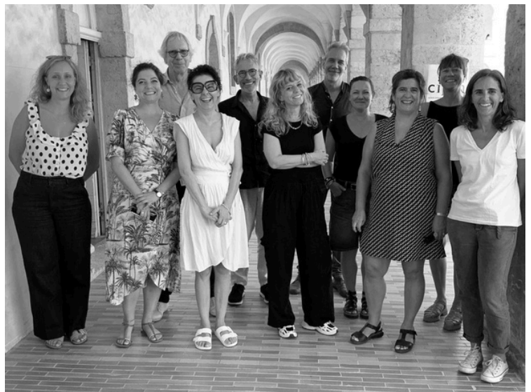
Réunion du Jury du Prix littéraire méditerranéen, le 2 septembre 2024 au Centre international Poésie Marseille, Centre de la Vieille charité

L'agence Karkadé a assuré la création d'un jury d'une dizaine de personnalités culturelles et littéraires, et la coordination de ses travaux de sélection, l'invitation des jurés, l'organisation et l'animation de ses réunions, la création de la liste des ouvrages éligibles, le contact avec les éditeurs des ouvrages pré-sélectionnés, l'invitation des finalistes au salon du livre métropolitain, et enfin l'accueil et la coordination du séjour des finalistes.