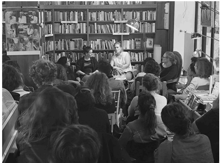
Rencontre "Marseille en lettres arabes" à la Grande Librairie Internationale de Marseille, le 17 septembre 2024

Rencontre menée en partenariat avec la Grande Librairie Internationale de Marseille et la Baam - Bibliothèque Arabe Associée de Marseille.