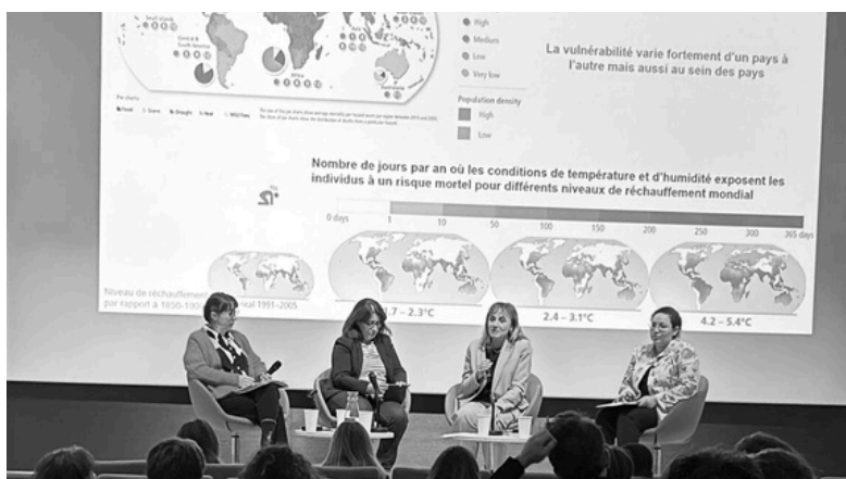
Panel de la rencontre "Migrations et climat" au Musée de l'Homme, le 2 décembre 2024