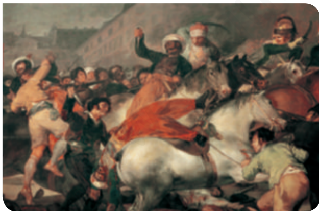
El 2 de mayo de 1808 en Madrid.

4 Observa los siguientes cuadros de Goya y explica qué reflejan cada uno de ellos.