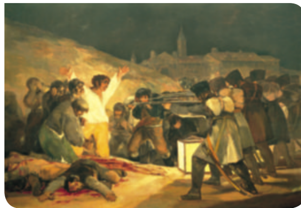
El 3 de mayo de 1808 en Madrid.

5 Selecciona algún acontecimiento de la historia reciente de España y elabora un cuadro en el que lo reflejes. Ten en cuenta los siguientes aspectos: elige un estilo artístico (puede ser realista o abstracto) y escoge los materiales que vas a emplear (pinturas, collage...).