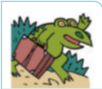
Don Sapo viajó a Buenos Aires.