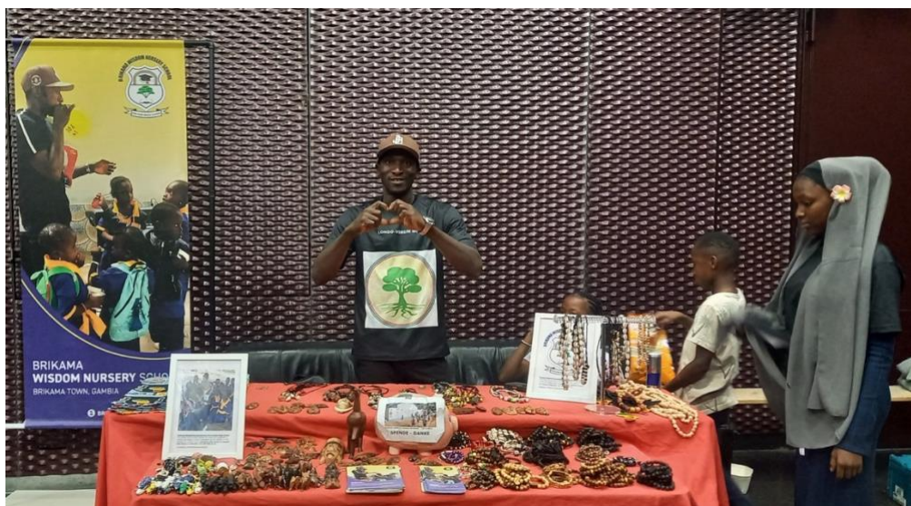
Abb.1. : Verkaufsstand WUK-Straßenfest und Flohmarkt September 2025

Weiters sind bereits T-Shirts für die ehrenamtlichen Mitarbeiterinnen an den Verkaufsständen umgesetzt worden.