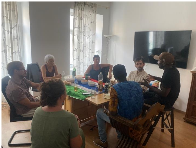
Abb.2: Vereinstreffen November 2024

Diese werden jetzt mit Hilfe der Gemeinschaft, dem LONDO-Verein, bewerkstelligt . Dabei geht es um den Transfer und / oder die Übersetzung der benötigten Anliegen im Sinne des Transfers von Know-how und Mittel für die Gestaltung der Schule und die Entwicklung der Kinder. Der Verein hilft bei der Organisation von finanziellen Mitteln und somit der Möglichkeit gemeinschaftlich zwischen Gambia und Österreich zu wirken. Dazu sind viele „Tools“ und „Skills“ gefragt. Diese werden ehrenamtlich von Freunden bewerkstelligt und brauchen weitere engagierte Kräfte.