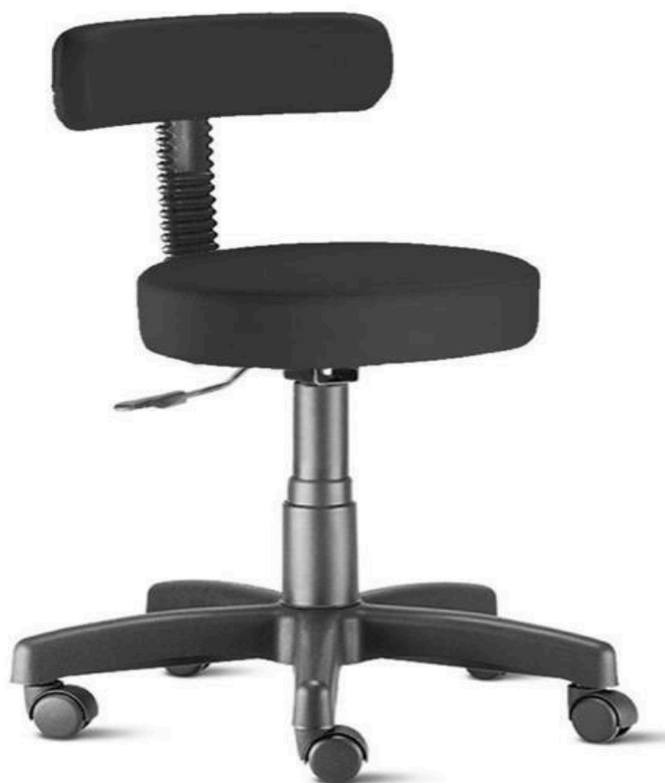
Assento e encosto cadeira mocho com base giratória