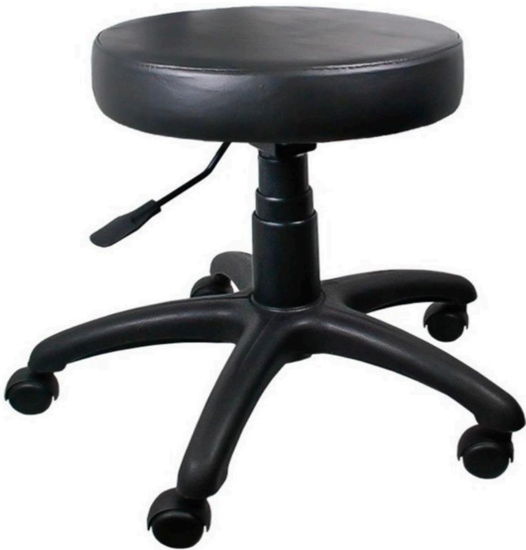
Assento de mocho em couro preto com base giratória e pistão à Gás