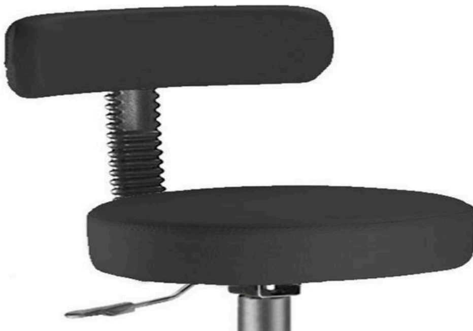
Assento e encosto cadeira mocho com base giratória e pistão a gás